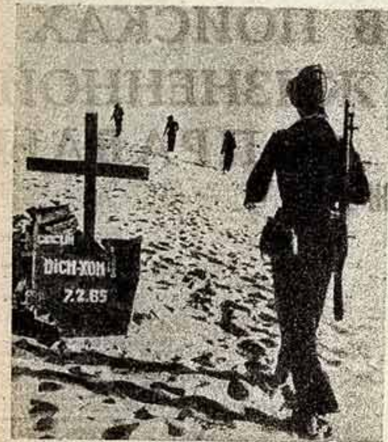
Женщины в строю пограничников, они несут службу в одной из провинций ДРВ. Как символ краха попыток агрессора уничтожить свободный народ — крест на обломках отбитого американского самолета.