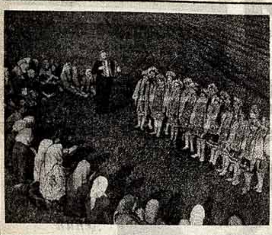
Черниговская область. Агиткультбригада Березовского дома культуры — один из лучших в Ивановской области. С началом работы агиткультбригады и политинформаторы регулярно выступают на тренторных и полесных станциях. Политинформаторы рассказывают о ходе работ в колхозе, знакомят с новостями в нашей стране и за рубежом. Не скимает местная колхозная ансамбль агиткультбригады выступать в поле перед колхозниками.