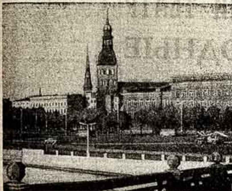
Рига — столица Латвийской ССР. Выступает Литовский ансамбль песен и танца «Летува».

ОРГАН МИНИСТЕРСТВА КУЛЬТУРЫ СССР И ЦЕНТРАЛЬНОГО КОМИТЕТА ПРОФЕССИОНАЛЬНОГО СОЮЗА РАБОТНИКОВ КУЛЬТУРЫ