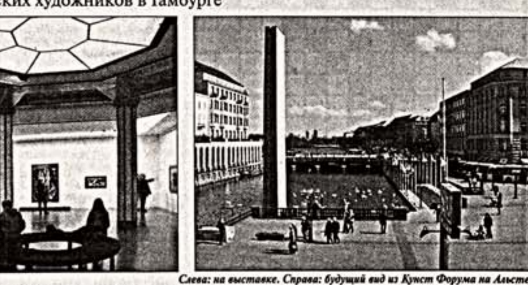
Слева: на выставке. Справа: будущий вид из Kunst Forum на Альстер

Екатерина БЕЛЯЕВА Зальцбург — Москва