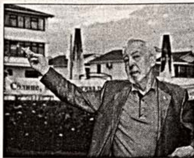
А. Битов — председатель жюри кинофестиваля