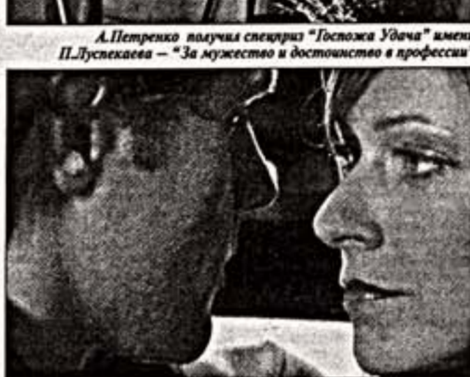
Кадры из фильмов "Осенний бал" и "Коллекционерша"