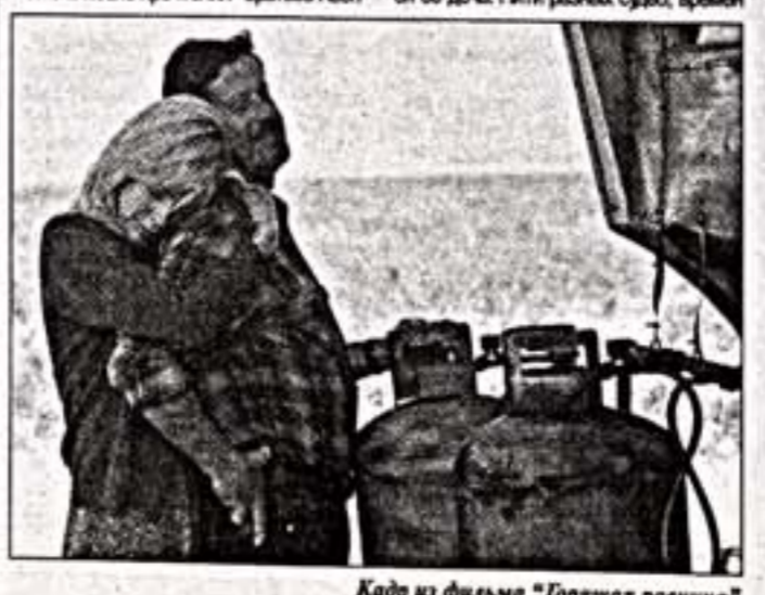
Кадр из фильма "Горная равнина"