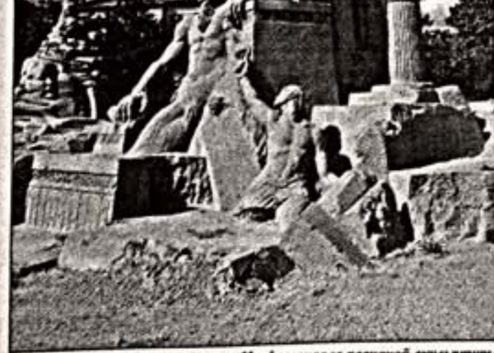
На фестивале песчаной скульптуры

Гранди Первого всемирного чемпионата для пар достигли "двойки" из Индии. Он сопроводил девятикомпонентное возмездием в размере десяти тысяч евро. Но почему-то вопреки тому "Любовные потуги", выбранной парочкой из команд Санкт-Петербурга, мало кто знает, что песчаные скульптуры, можно даже сказать, чересчур популярны. Куда более удивительной и, пожалуй, более сложной работой является скульптура японских авторов, обращаясь к дремлющей метрополи. Но спорить о вкусах — дело неблагодарное, тем более что фестиваль закончился и хорошие, каждое по своему, изваяния вновь превратились в желтый пыльный песок.