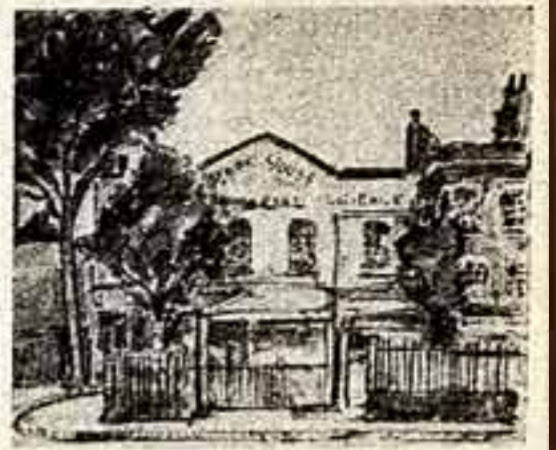
Ф. Лонге. Город Трир. Здесь 5 мая 1818 года родился Карл Маркс. Мемориальный дом-музей Карла Маркса в Лондоне.