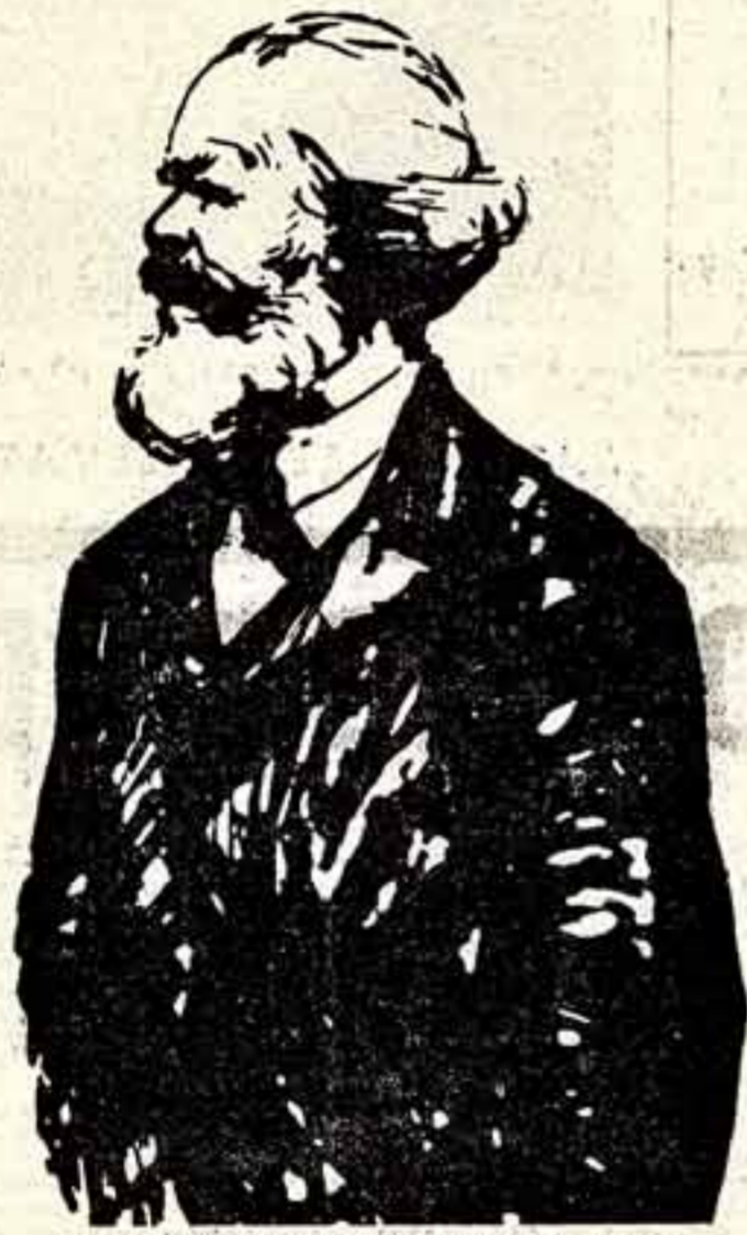
Курт Циммарман. Графический портрет Карла Маркса.