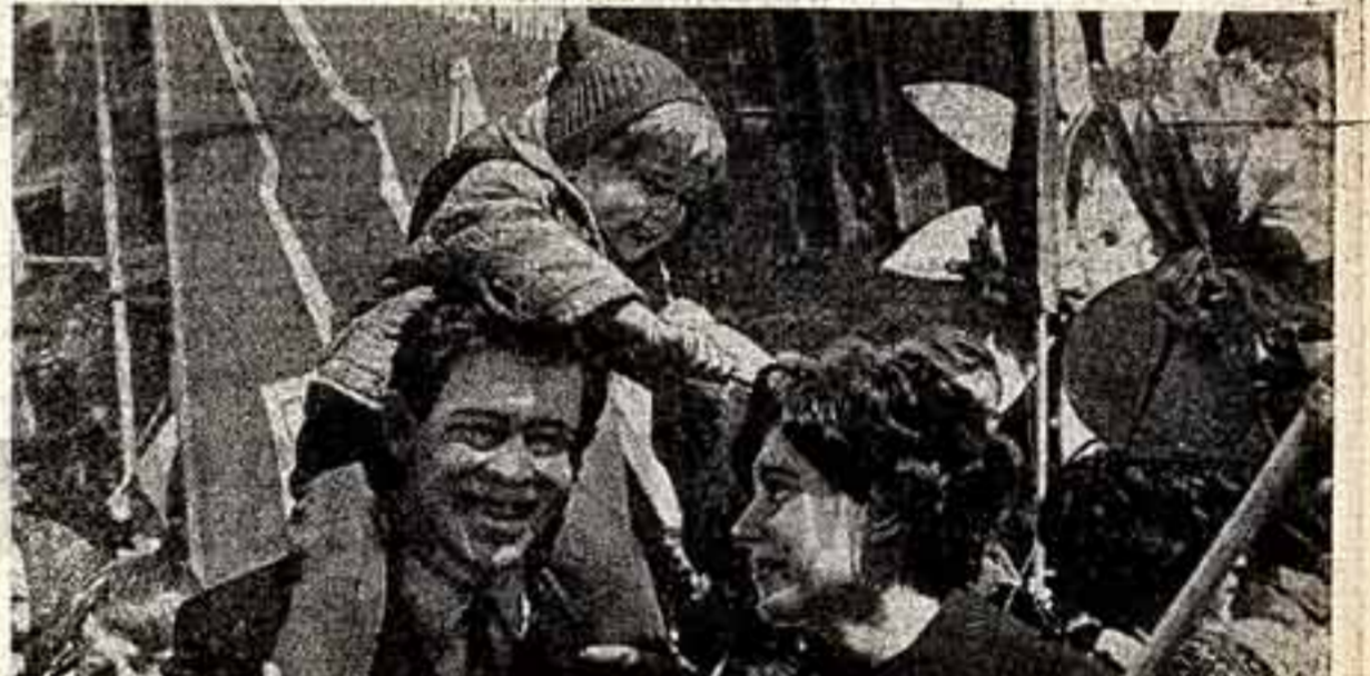
Первомаяские колонны на улице Горького в Москве.

Москва — сердце великого Союза Советских Социалистических Республик, светом мира и дружбы народов. В день Первомая в нежной зелени ее бульваров, скверов и парков яркими кострами вспыхивали тысячи и тысячи алых знамен.