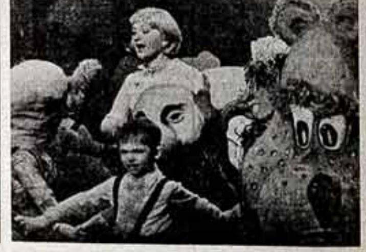
Клара Румянова.