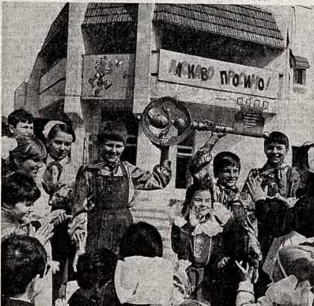
Зал, рассчитанный на 280 зрителей, имеет оригинальную архитектуру, хорошую акустику. Самой современной аппаратурой оснащена сцена — именно здесь ожидают кукол и происходит волшебное чудо сказки. Свою работу новый театр начал с постановки «Смелой сказки» по мотивам произведения Аркадия Гайдаря.