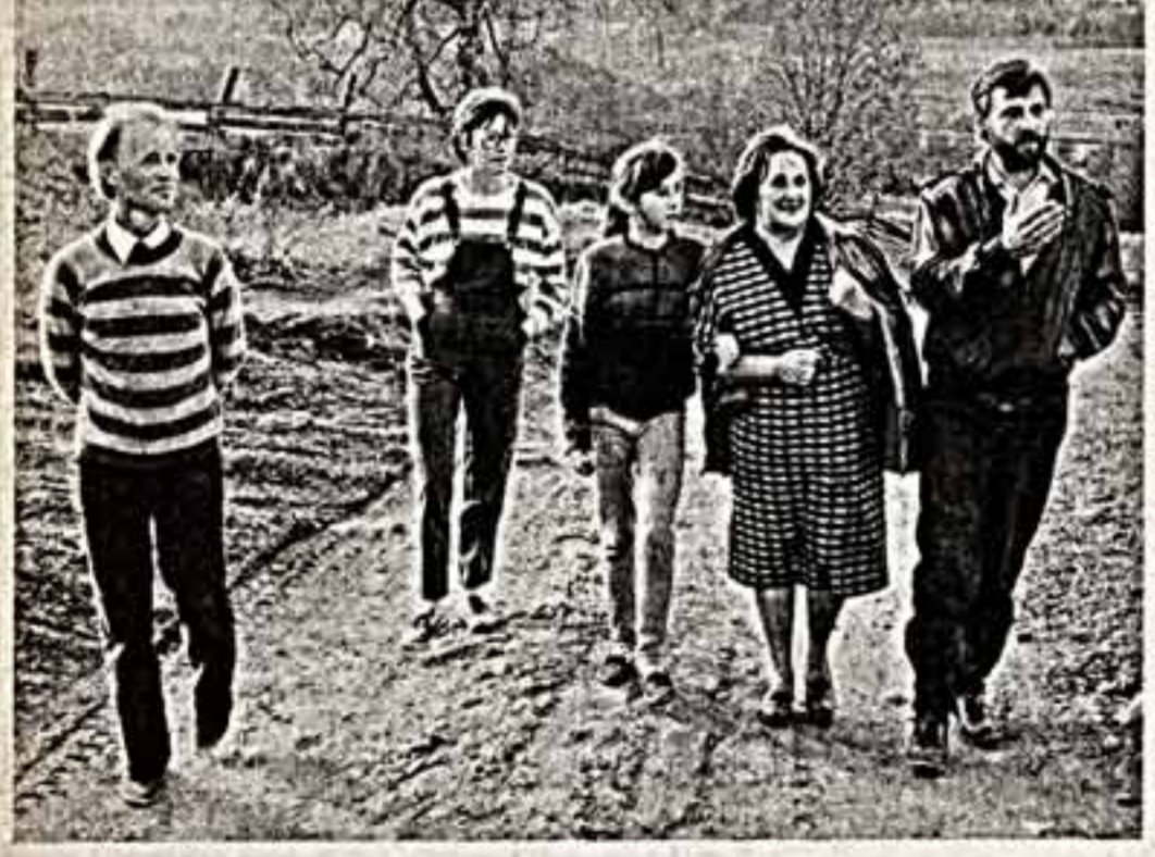
Хотим через газету обратиться к Генеральному прокурору СССР. Побуждаем нас к этому то положение, которое сложилось около 30 лет назад с фондом произведений искусства и других культурных ценностей Николая Константиновича Рериха.