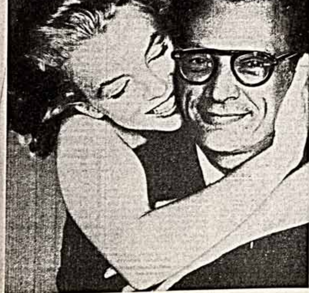
Вашу газету я читаю почти всегда, но никогда не встречала, хотя бы в малейшей заметке об американской «звезде 50-х годов Марии Володина, трагически погибшей 28 лет назад. Очень прошу опубликовать о ней материал.