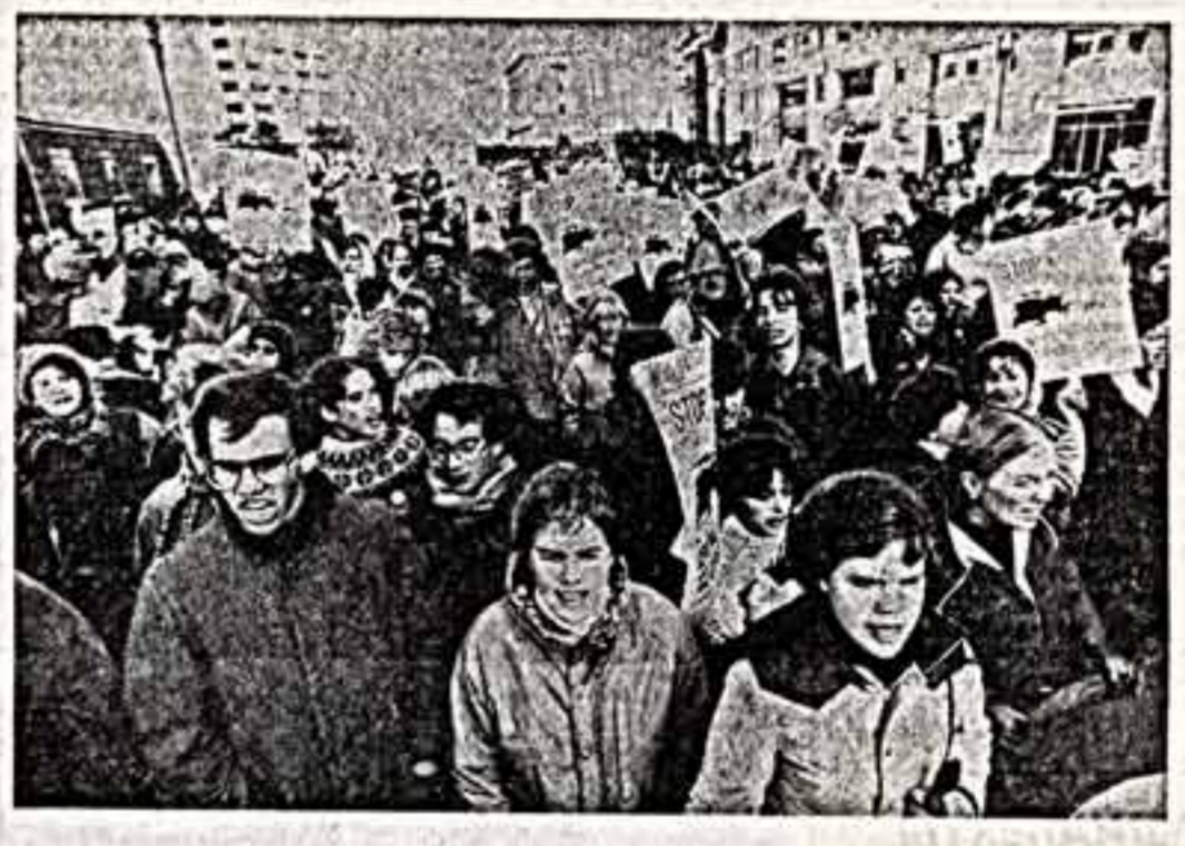
В Соединенных Штатах не прекращаются демонстрации протеста против агрессивного курса администрации Рейгана.