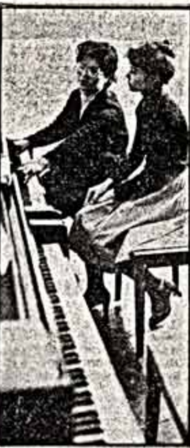
Ансамбль народных инструментов на репетиции.