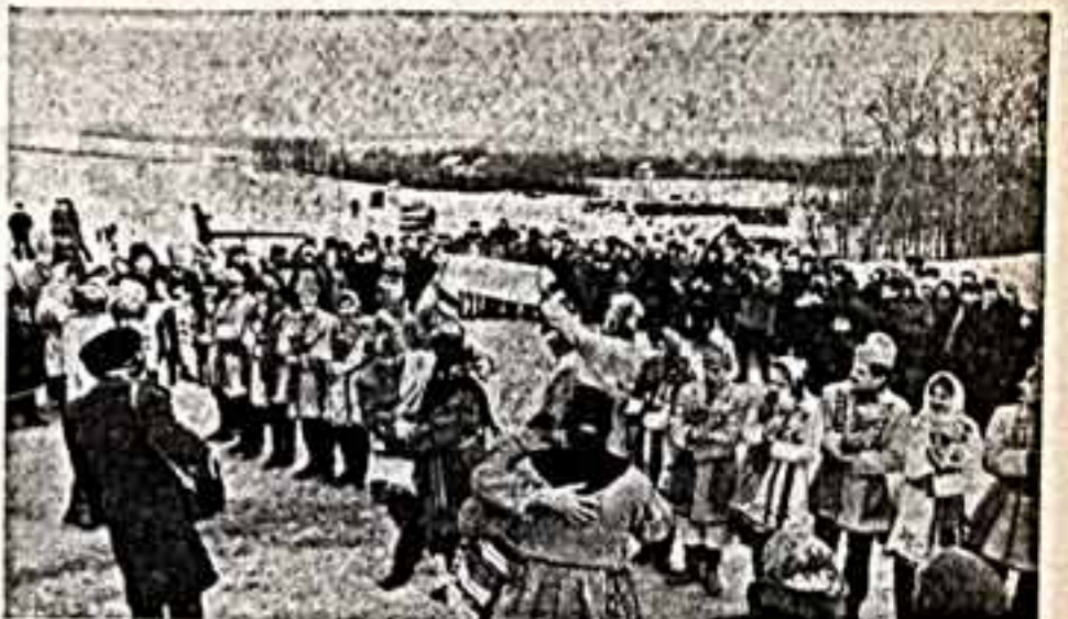
«Полтавщина» — древнейший указатель в этом названии помещается на щепе у одного из партнеров гражданско-го — это пятьдесят гектаров — национальный этнографический заповедник Музея народной архитектуры и быта Украинской ССР.