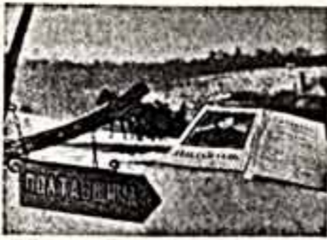
Листая голголевские страницы... К 175-летию со дня рождения