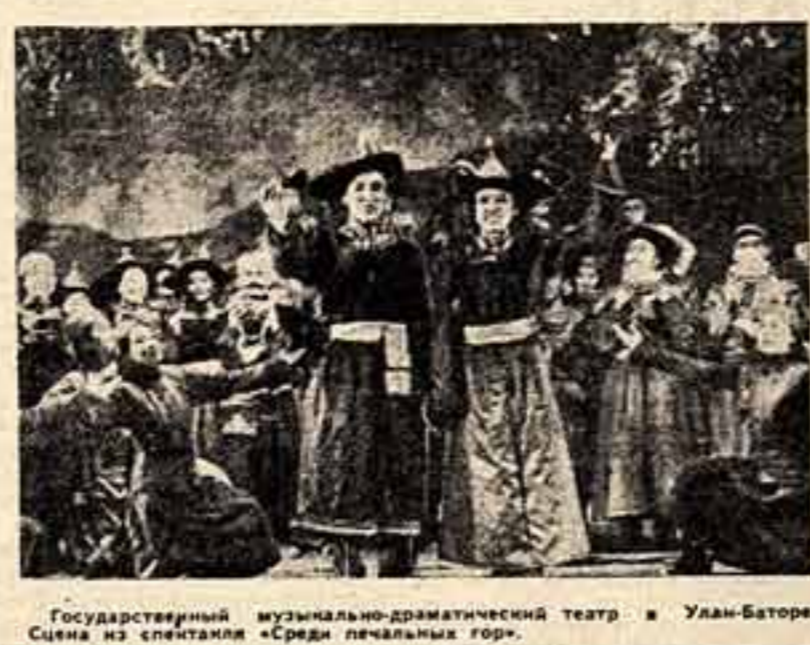
Государственный музыкально-драматический театр в Улан-Баторе. Сцена из спектакля «Среди печальных гор».

22 мая 1947 года в Улан-Баторе было основано Общество монголо-советской дружбы.