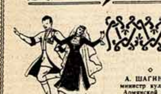
А. ШАГИН, министр культуры Армянской ССР

Юбилейный год ознаменован в Армении созданием многих новых очагов культуры. Намечено, например, открыть постоянные филиалы республиканской филармонии и театра Еревана в городах Эчмиадзине и Охтисберине. Постоянные выставки творчества армянских мастеров изобразительного искусства устроятся в Степанаване и Кафане. В Нор-Балесте к 7 ноября будет завершена подготовка к открытию краеведческого музея. Дом-музей О. Иоаннисяна в Эчмиадзине к этому же сроку примет первых посетителей.