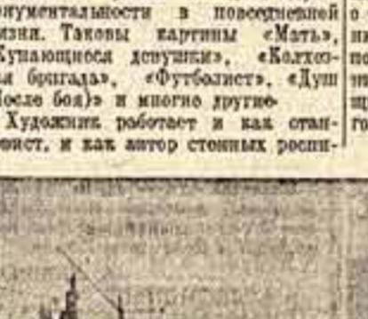
На просторах подмосковных степей (1949 год).

Художник работает и как автор стилистических приемов, разнообразием ритмов, красотой и зоркостью наблюдательного глаза. Прилепательность этих образов и том, что художник никогда не обильно на холоду, академическую трактовку обаяющего тела. В его физикокультурных эскизах узнаешь советских людей, для которых спорт — радостный отдых после труда. Тема молодежи в творчестве Дейнеки неразрывно связана с природой и городской пейзажем. В картине «Родные» он показывает красоту просторов большой русской реки, по берегу которой бегут группа стройных и сильных девушек, выходящих из воды на фоне пейзажа четкими силуэтами, стремительностью движения. Фоном для разрозненных действий большого полотна «Стафета по воле» («В») является широкая московская улица в яркий солнечный день. Органическим дополнением к фигурам людей в картине «В обходный перелет» в Донбассе служат залитые солнцем пейзажи и индустриальный пейзаж. Остатки пейзажа органически слиты с фигурами людей, работающих, бегущих с радостным смехом по воде, разбрызгивая вокруг себя светлые ослепительные брызги. Пейзаж в произведениях художника на спортивной теме подчеркивает красоту телесного тела, наполняет картину