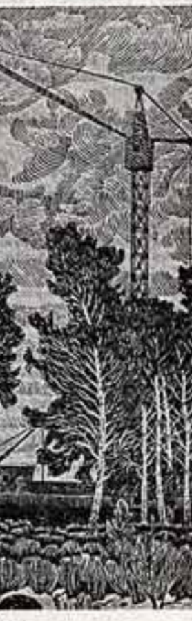
А. ВАГИН. «На Солнечной поляне».

что красота-то вот она, вокруг нас, надо только уметь видеть.