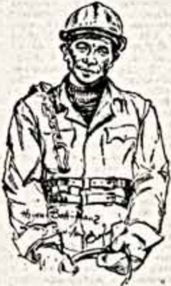
Мост «Тханг Лонг» на зме имеет второе название — «Дружба». Его возводит вьетнамские строители совместно с коллегами из Советского Союза.