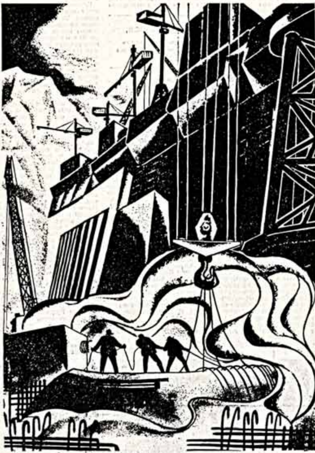
На монтажной площадке 8-й турбины Саяно-Шушенской ГЭС.

В серьезной перестройке нуждается, на мой взгляд, колхозное коммунальное хозяйство, особенно отношения с организациями, располагающими необходимыми сырьевыми материалами — цементом, плиткой, стеклом, но не имеющими строителей. Они находят изворотливый способ выполнять свой план: материалы отпускают, если колхоз платит не только за материалы, но и оплачивает строительные работы, которые производят сам. На тех же условиях колхозники вынуждены приобретать материалы для индивидуального строительства. Лазейку ловцам надо перекрыть. Ведь подобные просчеты в организации дела тоже препятствуют тому, чтобы села наши строились красиво, на уровне современных требований и запросов людей.