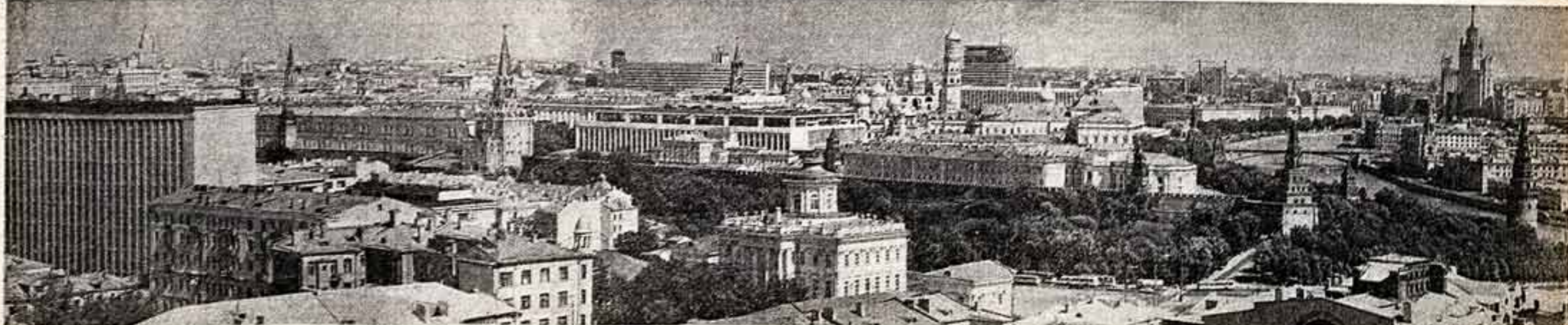
Москва — столица нашей Родины.

Заметки писателя Нехота уходит теплое нынешнее лето, вроде бы за много лет назад и памятно вперед обласало, обогрело оно северян, накармило досыта не только черниной и земляничкой, но и лютарной морщочкой, и рубиновой ежовиной.