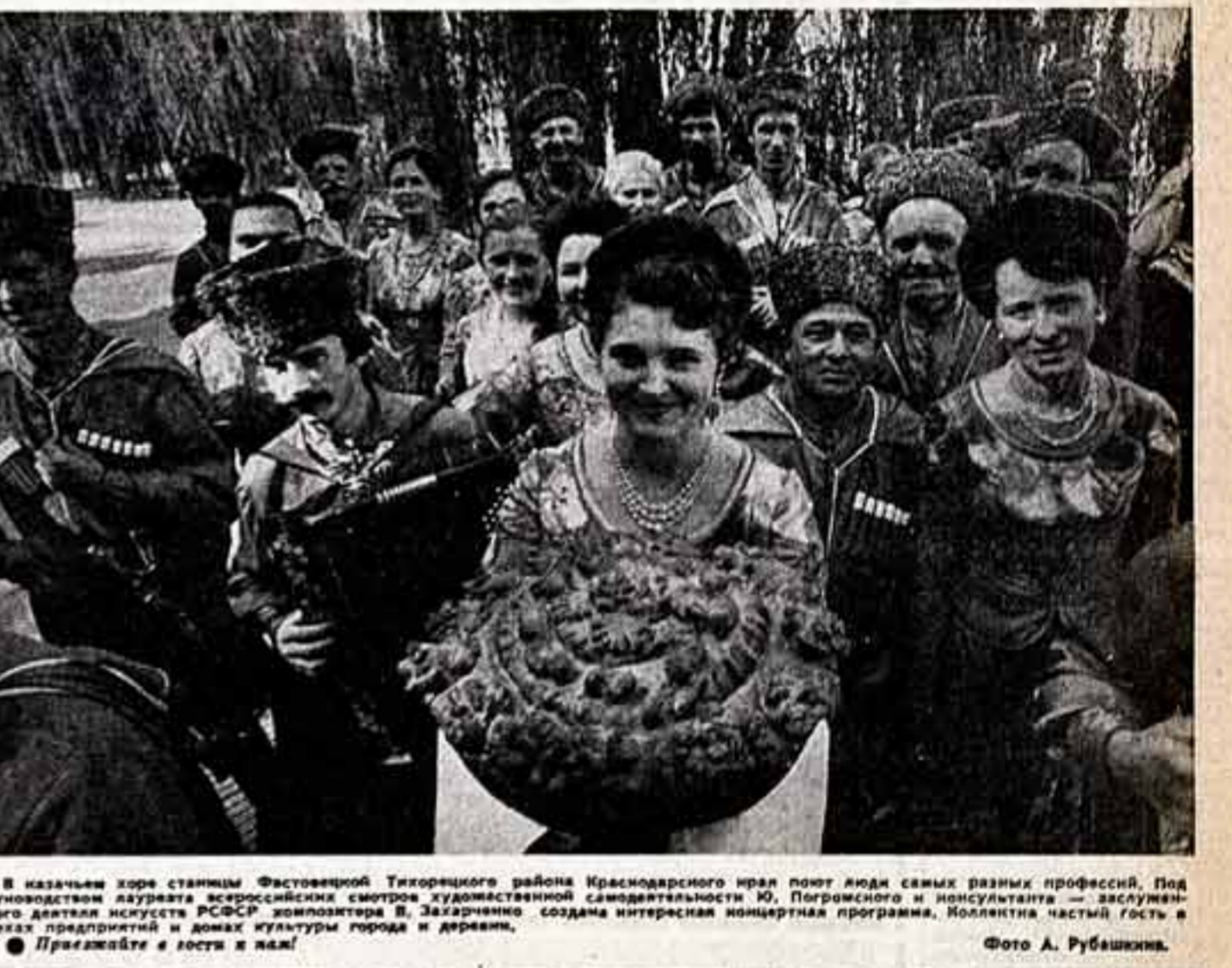
В казначействе станицы Фастовской Тихорецкого района Краснодарского края поют люди самых разных профессий...