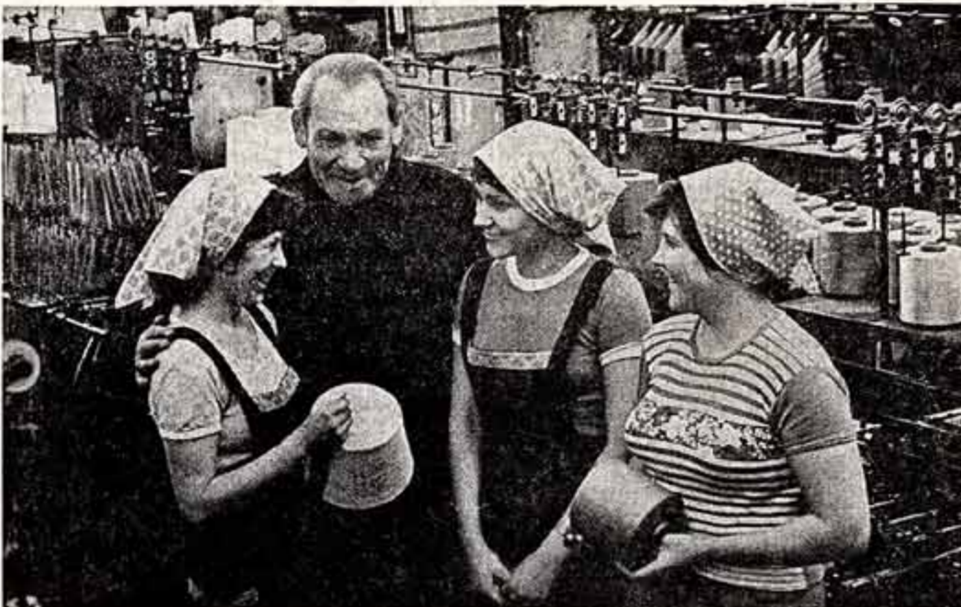
Теоретическое комитетом А. Новикова знакомо миллионам людей. Довная дружба связывает его с коллективами художественной самодеятельности Дома культуры имени В. И. Ленина комбината «Трехгорная мануфактура». Его встречи с рабочими всегда выливаются в яркий праздник советской песни.

Герой Социалистического Труда, народный артист СССР, композитор А. Новиков с рабочими завода «Трехгорная мануфактура».