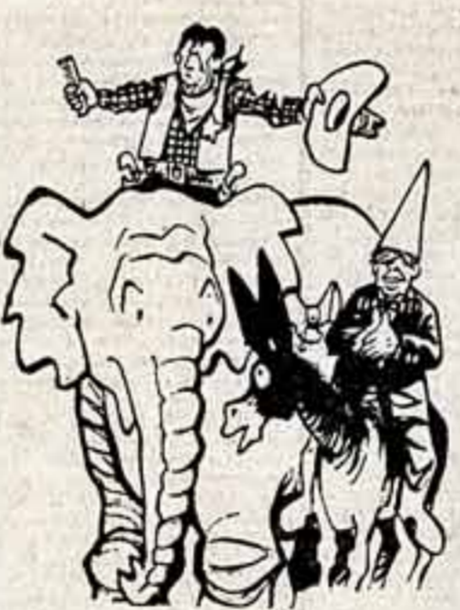
Откуда явилась эта клоунада? Рисунок из американской газеты «Чикаго сан-таймс».

Американская империя разваливается, потому что хозяева Банка никогда не обладали ясным мировоззрением. С одной стороны, они вроде бы отличные прагматики. Они провозгласили свои тезисы с Мао Цзунгом, Франко и еще черт знает с кем, если такие связи обещали им прибыли. В то же время они хотят и дальше идти эту громадную корову, то бишь республику. Единственный до сих пор известный им способ заполучить наши доллары в виде налогов — это постоянное запугивание нас «красной опасностью» бездонного коммунизма. Но это становится для них все труднее, потому что у всех на глазах с