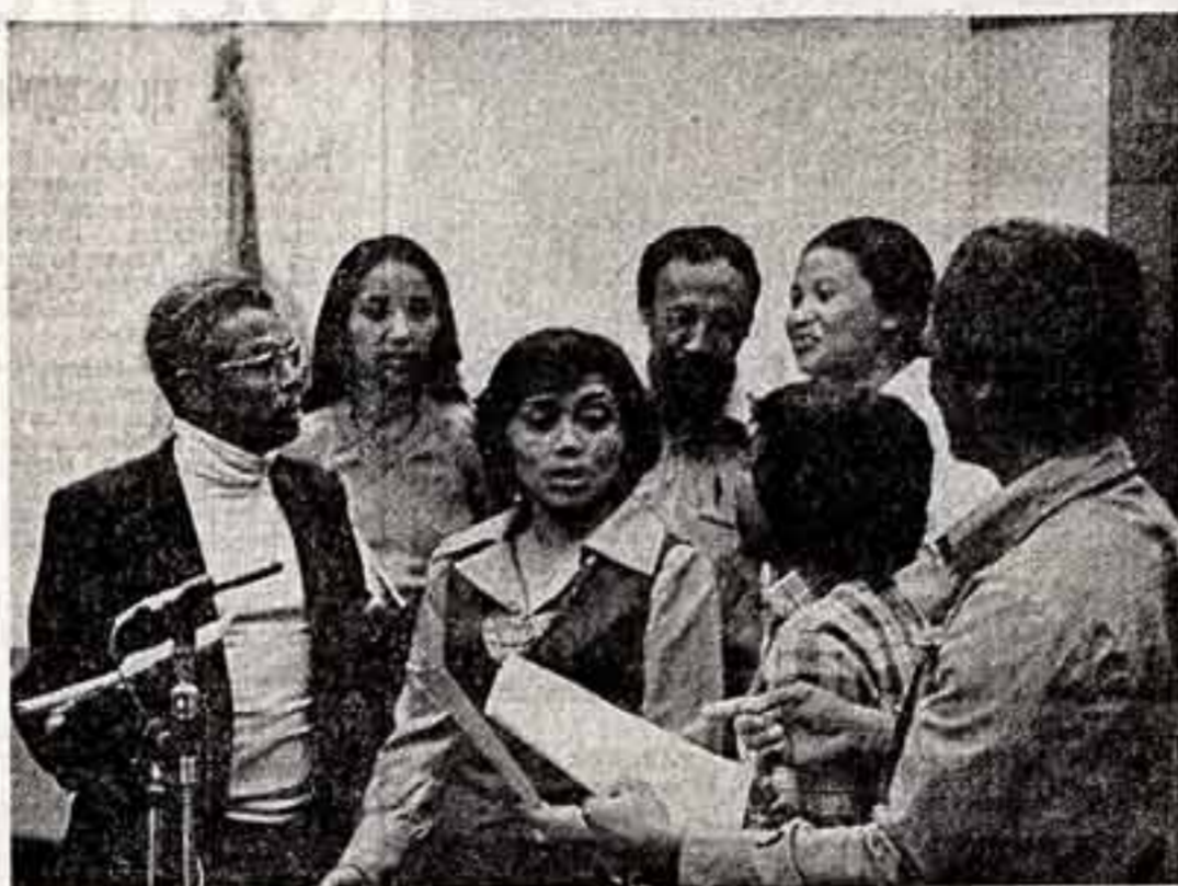
Малагасийская пресса, радио, кино и телевидение часто публикуют и демонстрируют материалы о Советском Союзе, кинофильмы, произведения советской литературы.