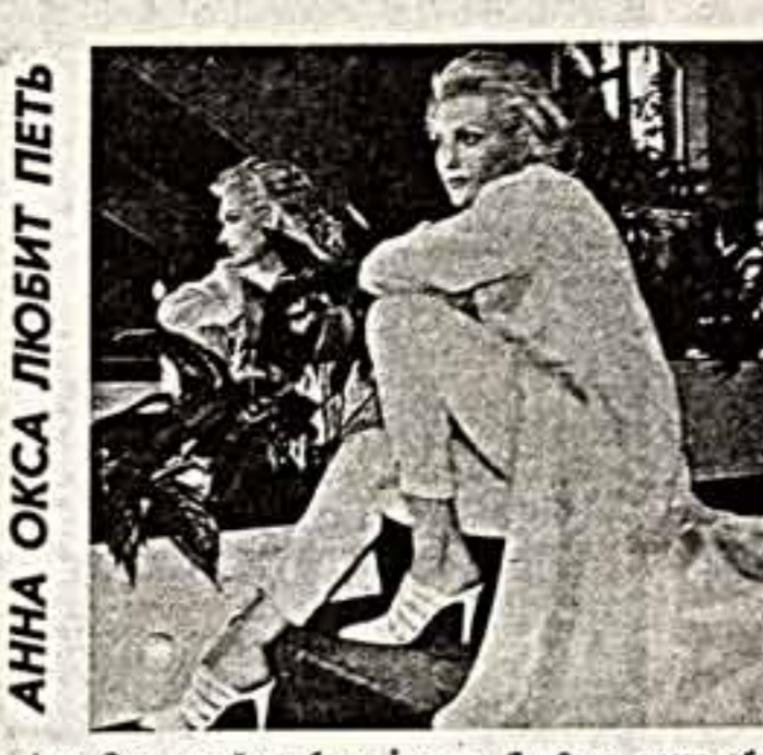
АННА ОКСА ЛЮБИТ ПЕТЬ