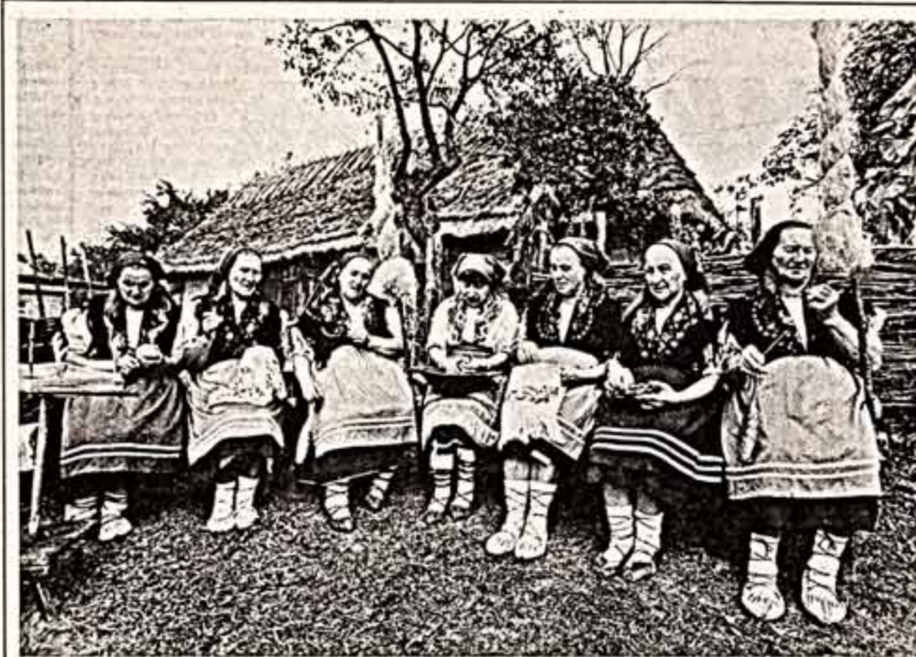
ЛЕЖКИ - этнографическая группа украинцев, издавна живущая в Карпатах. Отрочеством от освоения украинские земля, сложившиеся условия в близкие соседние народы (воляков, славоков, гуралов) сформировали эту этнографическую группу со значительным отщепением в хозяйстве, быту, культуре, языке.