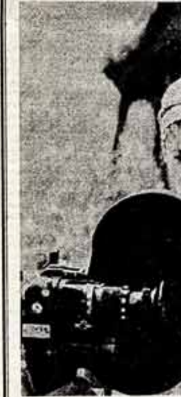
В Крыму проодит съемки фильма «Детство Бабич». Снимает австрийского писателя Феликса Зальтена переломника на Крымском полуострове. В роли режиссера — австрийский актер и режиссер Иоганн Райсманн.