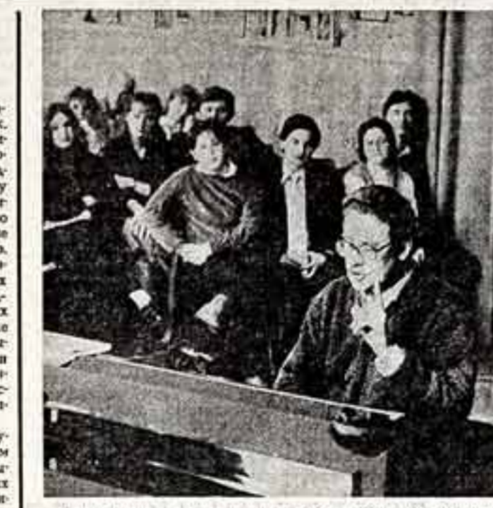
Важный вклад в укрепление дружбы и развитие культурных связей между народами СССР и Венгрии вносят творческие контакты в области искусства...