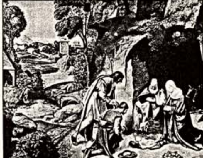
Джорджоне. "Поклонение волхвам"