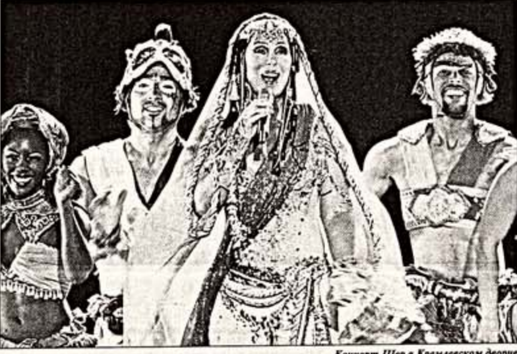
Концерт Шер в Кремлевском дворце