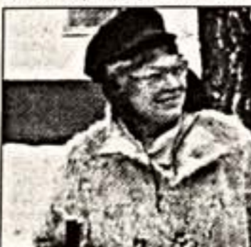
Кадр из фильма "В темноте"

Из дня сегодняшней инсталляци... (Обсуждение. Начало на 1-й стр.)