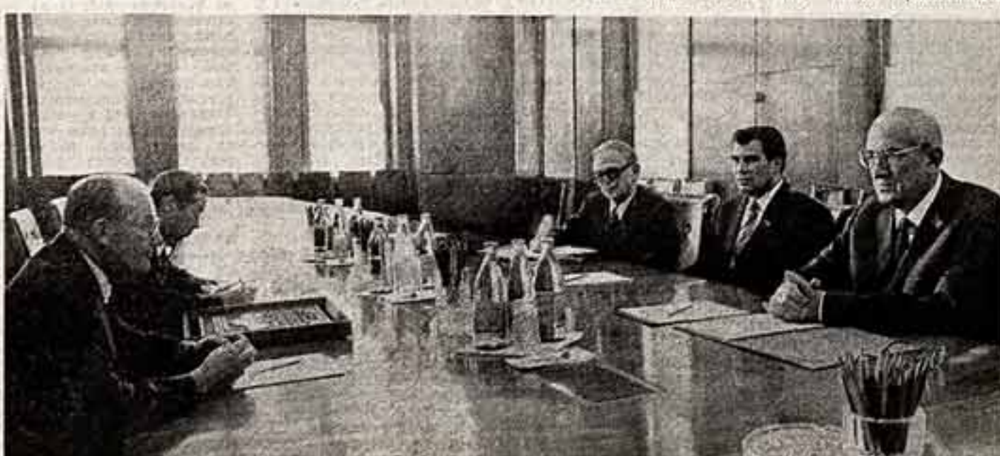
Во время беседы.

Библиотека в тысячу томов отправлена труженикам целинного совхоза «Киргизстан» Ярославской области из Общества кирилло-славянских издательств «Крепуть и рещируска» швейцарско-творческой интеллигенции горного края и хозяйства, которое создается в Нечерноземье с помощью киргизских друзей. В гостях у ярославцев побывали ведущие писатели и мастера сцены республики.