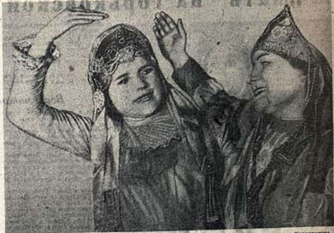
Вторая Московская областная олимпиада колхозной художественной самодеятельности.