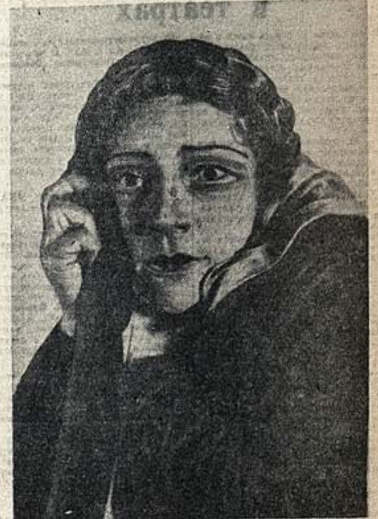
„Тихий Дон“. Вальс — Алесия