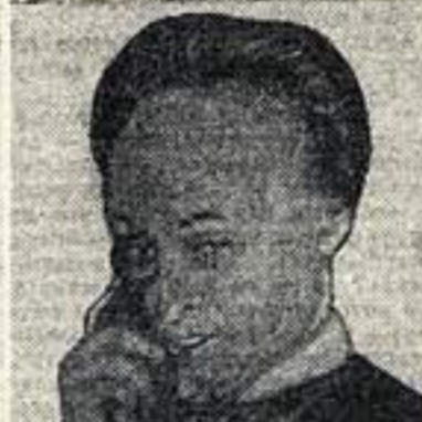
«Азорские острова» Наццель — Давидсон

Эта трагическая жертвенность заключилась в конфликте. Сказать делу было совсем неуживо, да и