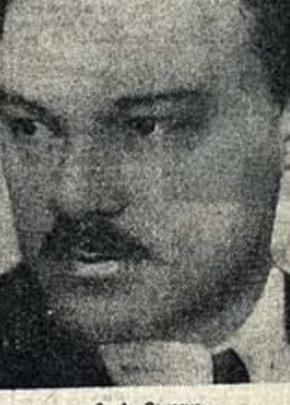
С. А. Самосуд

Имя Державина, «Тихий Дон» которого был недавно показан в Ленинграде с огромным успехом. Рост советского оперного театра — это не только рост оперного искусства, это рост культуры, это рост национального самосознания, это рост патристического чувства, это рост любви к своему народу, к своей Родине, к своему будущему. Это рост культуры, это рост национального самосознания, это рост патристического чувства, это рост любви к своему народу, к своей Родине, к своему будущему.