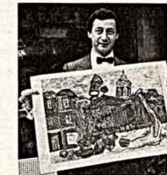
Александр КАМЕНСКИЙ. «Отто ПИИЕ. «Дымовая картина», 1961.