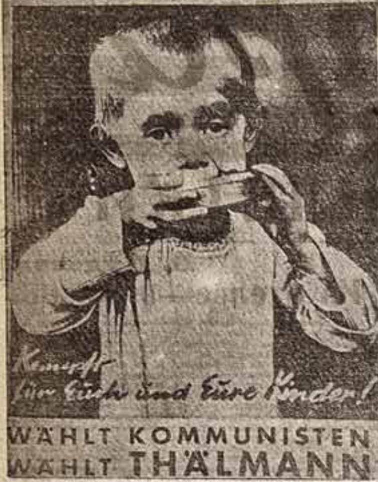
Германский коммунистический плакат худ. Гартфельда

Das letzte Stück Brot raubt ihnen der Kapitalismus