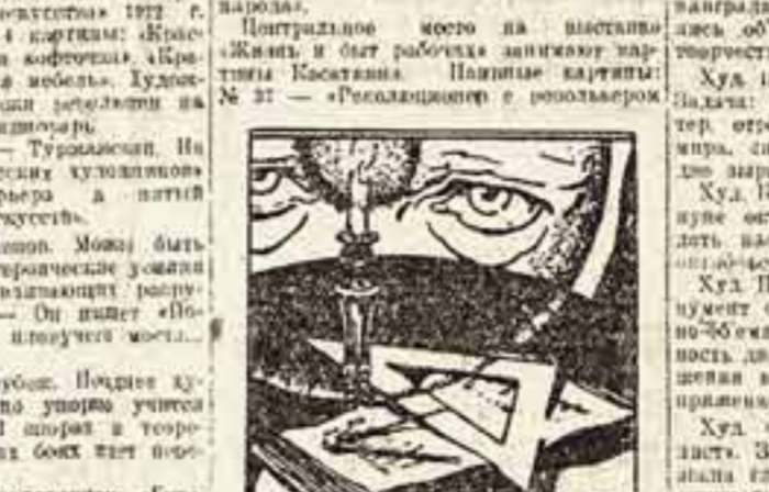
Заставка из каталога (1922 г.)