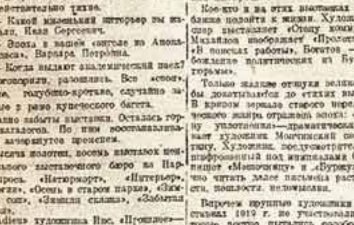
Союз русских художников

В 1922 году в Москве было издано первое издание каталога Союза русских художников. В 1922 году в Москве было издано первое издание каталога Союза русских художников. В 1922 году в Москве было издано первое издание каталога Союза русских художников.