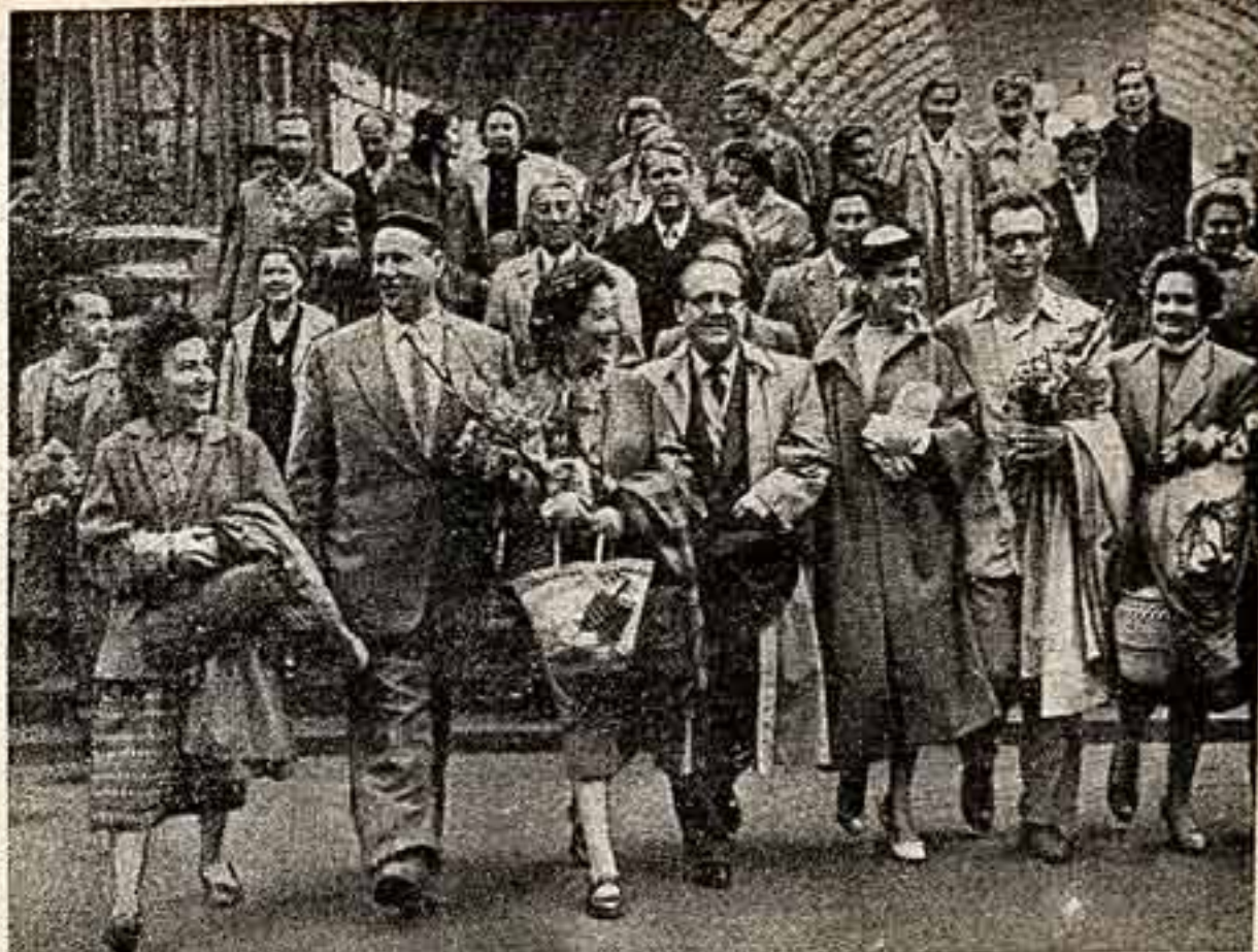
Встреча коллектива Будапештского оперного театра на Киевском вокзале в Москве.

Подготовленным поисками характерности отмечен номер жонглиста Клаудиа Беккерс. Он — веселый, чуждающийся официант; его ассистента — посетительница кафе. Стремясь завоевать ее внимание, он проделывает, казалось бы, невероятное: стоя на одной руке, пьет чай, достает с обложки манжетов велосипеда уроненный на пол кусок сахара, делает несколько сложных акробатических