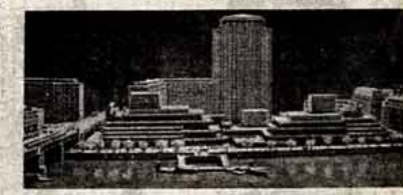
Перед взором Оливье — проект размещения нового здания Национального театра Великобритании. Слева — будущее здание Оперы, справа — само здание Национального театра (основная сцена на 1000 зрителей), и между ними — экспериментальный театр. В центре — громадная небоскреба молчаливо «Шалль», нетронутой, как говорит англичанин, они отнюдь не годятся.

Играя в нескольких спектаклях сразу, он вместе со своим помощником читает новые пьесы, работает с молодыми актерами, ездит в провинциальные города, участвует в утренниках для молодежи (Оливье уверен, что молодежи нужен свой театр, со своим репертуаром, и его очень интересует то, что сделано в этой области в Советском Союзе). Поэтому, когда в 4-й раз за неделю ему предлагали «продать» свой дом, Оливье ответил: «Ктобы — другие увлечения, драма театра, он, перебрал в уме различные варианты, серьезно отвечает, что, пожалуй, нет».