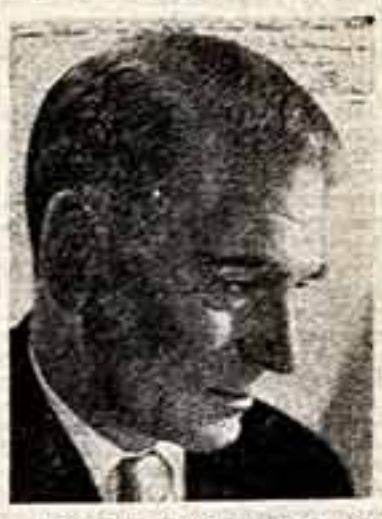
Передая этот снимок читателям «Советской культуры», Лоренсо Оливье написал на фотографии: «Теория следует за успехом и признанием. Культура следует за теорией». Искусство — это начало и конец».