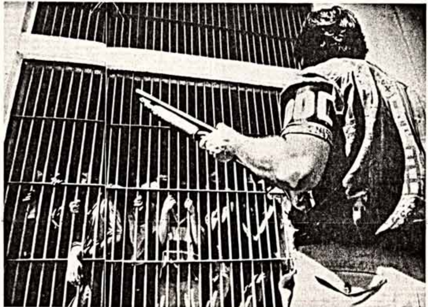
Прошло более двух месяцев с того дня, когда американский президент Джордж Буш, обращаясь по телевидению к гражданам своей страны, показал плакат с изображением «белой смерти» в США, однако заметный успех он не принёс. Новый президент объявил, что намерен коренным образом изменить стратегию борьбы и недавние события показали, что он настроен крайне серьезно. Принятыми решительными мерами, чтобы прервать путь доставки наркотиков в Северную Америку. Известно, что злонь поступает главным образом из Юго-Восточной Азии, Японии и Латинской Америки. Только из трех латиноамериканских стран — Перу, Колумбии, Боливии — в США ежегодно завозят двести тонн кокаина. В результате этого с 1981 года потребление «белой смерти» здесь утроилось. По сведениям статистических служб, одни американец из трех курит марихуану, один из десяти — хант кокаином. В беднейших кварталах до 50 процентов детей рождается с умственной отсталостью от родителей — наркоманов и наркотики. За решеткой — распространители наркотиков.