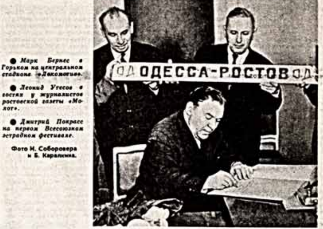
● Марк Бернес в Горьком на центральной студии «Лексикон».