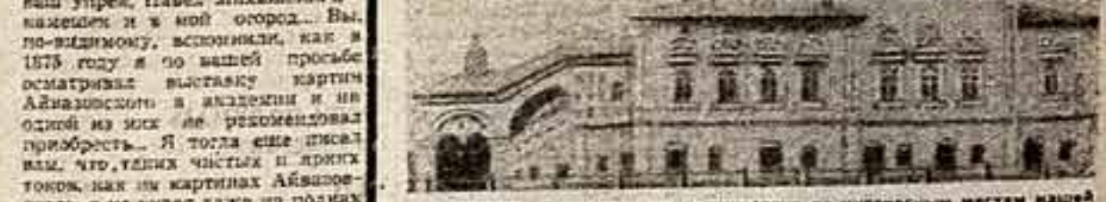
СЕГОДНЯ мы предлагаем путешествовать по интересным местам нашей страны. Предлагаем посетить новый маршрут — и исторический город Великий Устюг.