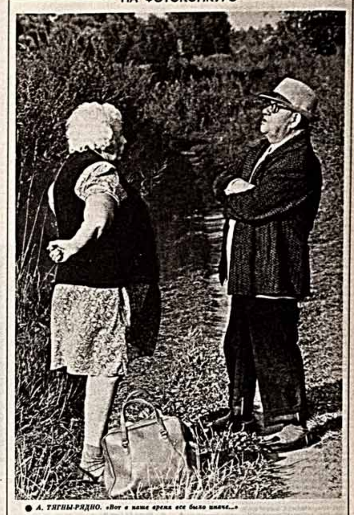
А. ТИГНЫ-РЯДНО. «Вот в наше время все было иначе...»

Кооперация сказала свое первое слово. Его нужно тщательно взвесить, обдумать и скупрулезно запнать, не пропуская ни одной буквы. Это слово должно начать летопись нового экономического мышления, нового реального и ответственно осмысления нашей хозяйственной деятельности. Кооперация нуждается во вдумчивом, беспристрастном анализе.