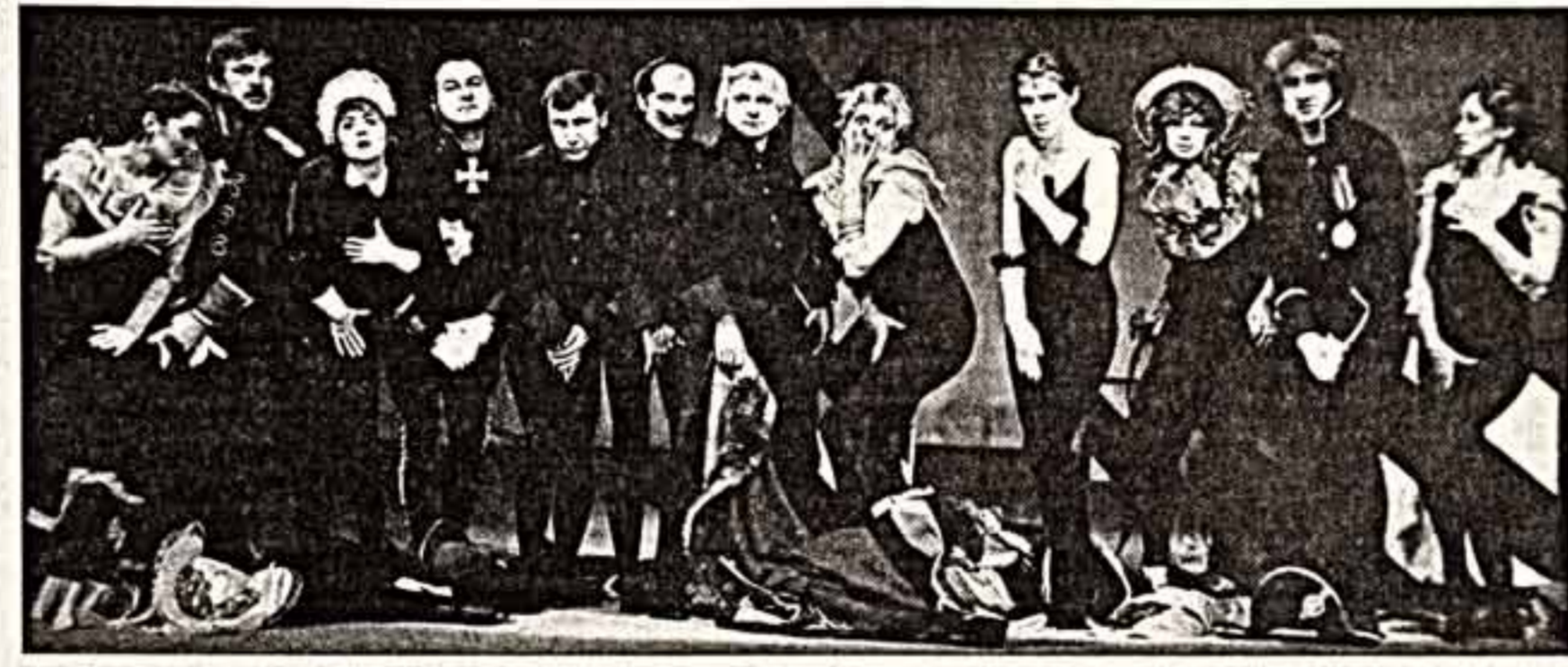
«Химера». Фото спектакля.