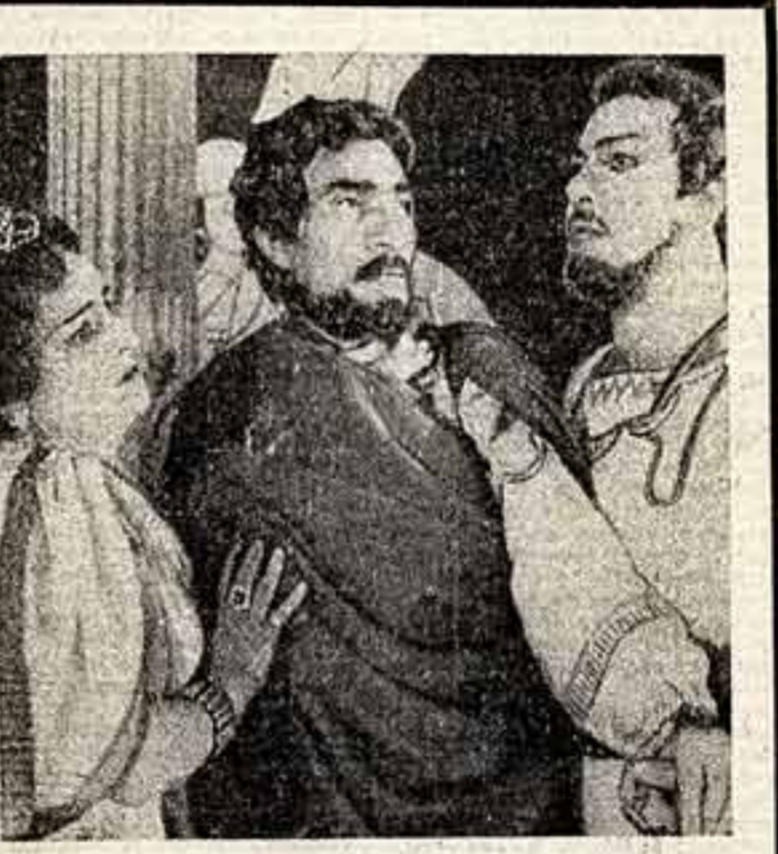
Ленинградскому драматическому театру Армянской ССР, деятельность которого имела большое значение для возрождения традиций армянского театрального искусства, исполнилось сто лет. В дни юбилейной коллективной театра показан спектакль «Артавазд» Л. Мелинаки. Вы видите сцену из этого спектакля.

МОСКВА. (Пресс-служба «СК»). В шестом издании Центрального парка культуры и отдыха имени Горького открывается выставка «Африка в произведениях советских художников». Около 150 полотен рассказывает о жизни, труде и быте, о замечательном искусстве Ганы, Гвинеи, Мали, Сенегала, Уганды. Это творческий отчет советских живописцев и графиков о поездках в страны Африки.