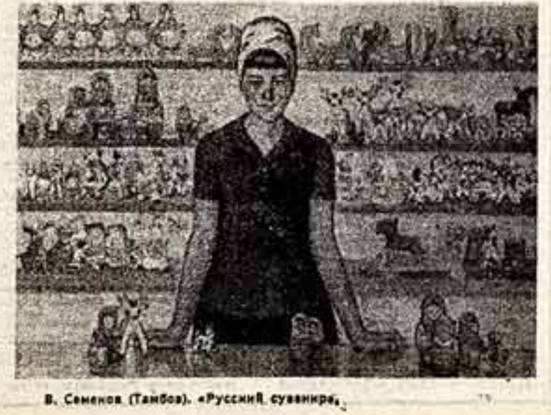
В. Семенов (Тамбов). «Русский сувенир».