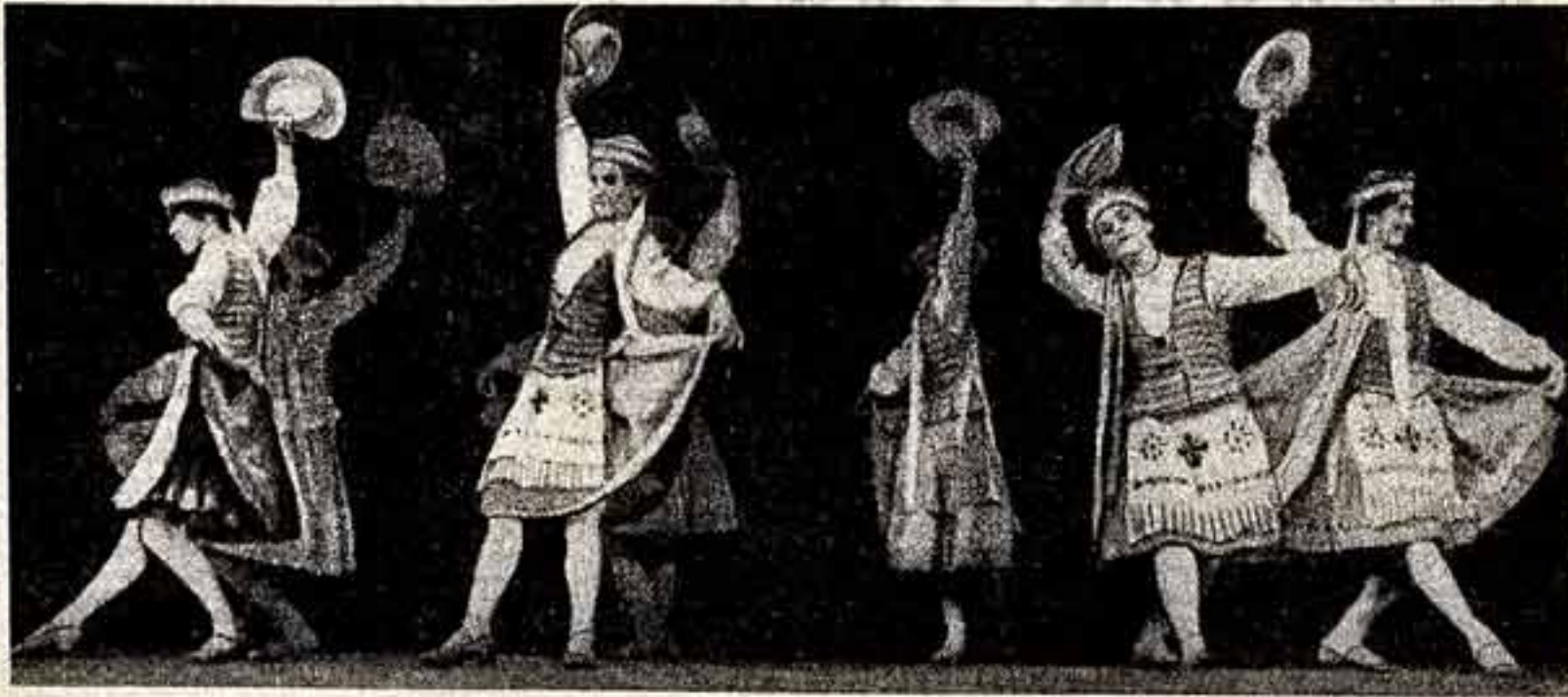
Сюита литовских народных и современных танцев. Выступает самодеятельный коллектив Каунасского радиоакадемии. Репродукция А. Алексеева. Фото В. Шиндлерова.

ВЧЕРА УТРОМ гости возложили венки к Мавзолею В. И. Ленина. А ВЕЧЕРОМ в Театре имени Моссовета состоялась волнующая встреча трудящихся столиц с посланцами литовского народа.