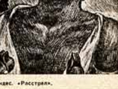
Леопольдо Мендес. «Расстрел».