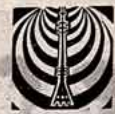
РАЗГОВОР ВЕДУТ ПРОФЕССИОНАЛЫ