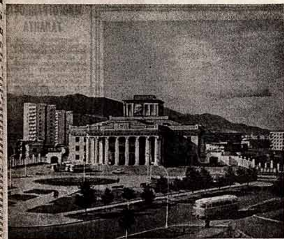
Богатой, разнообразной жизнью живет столица Монголии — Улан-Батор, которую сегодня называют «Бибикампо».