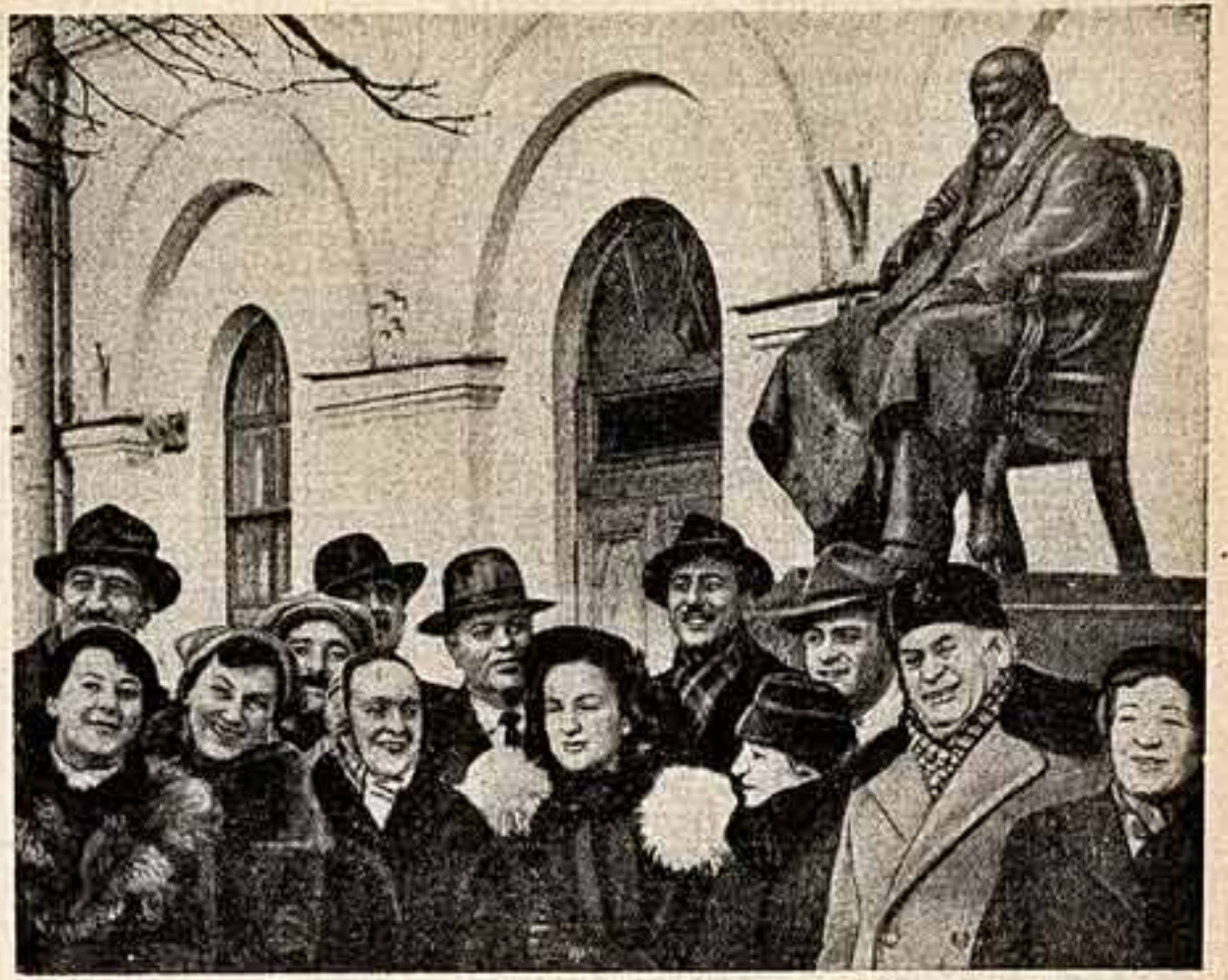
Группа участников декады грузинского искусства и литературы — артисты Театра имени К. Марджанишвили в Москве у памятника А. И. Островскому.

1958 год 22 МАРТА СУББОТА № 35 (749) Цена 40 коп.