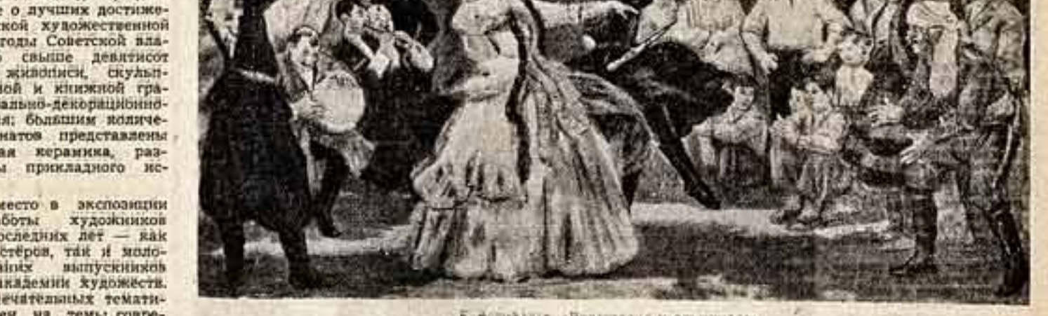
Г. Тотбадзе. «Подготовка и олимпиада».