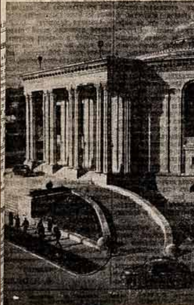
Кутаиси, Залы театра имени Лаво Месхивили.