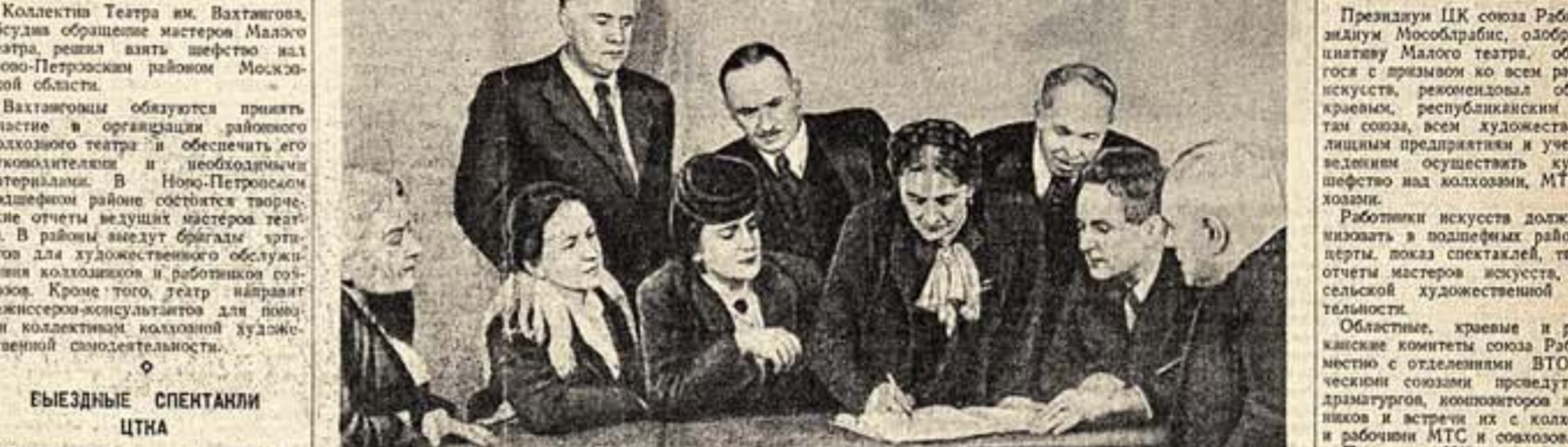
Коллектив Малого театра взял культурное шефство над Высоковским районом Московской области и обратился ко всем работникам искусства с призывом помочь успешному проведению посевной кампании...