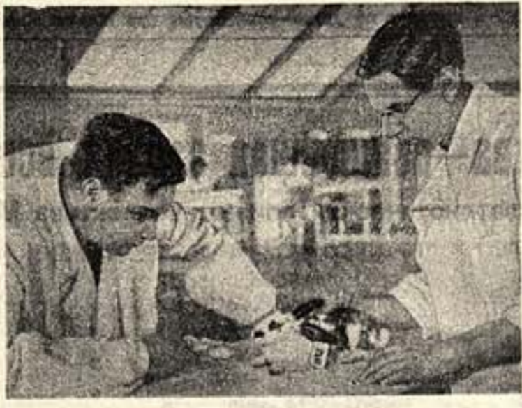
Кадр из фильма «Во имя жизни»...