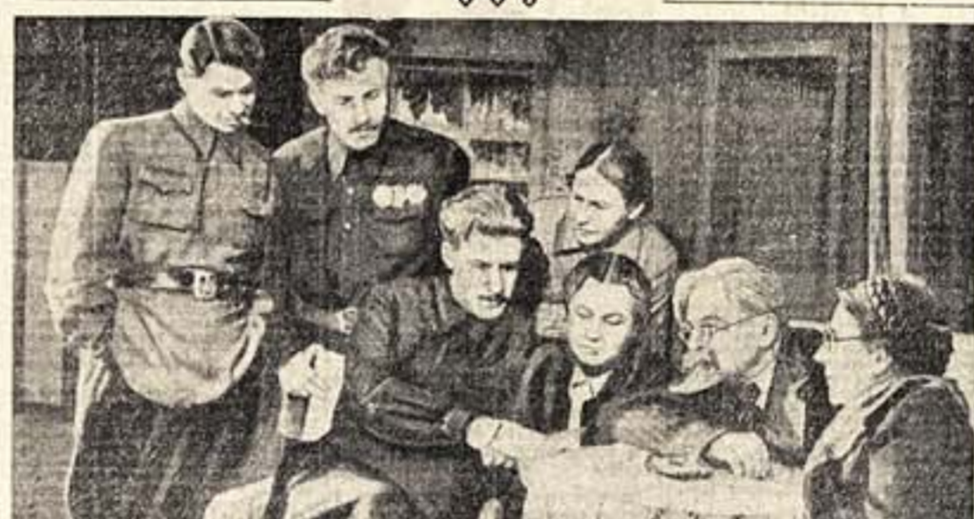
Писса А. Сухова «Далеко от Сталинграда» в Воронежском государственном драматическом театре...