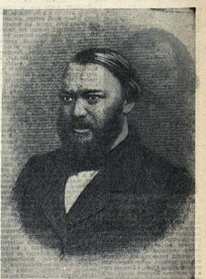
А. Н. Островский