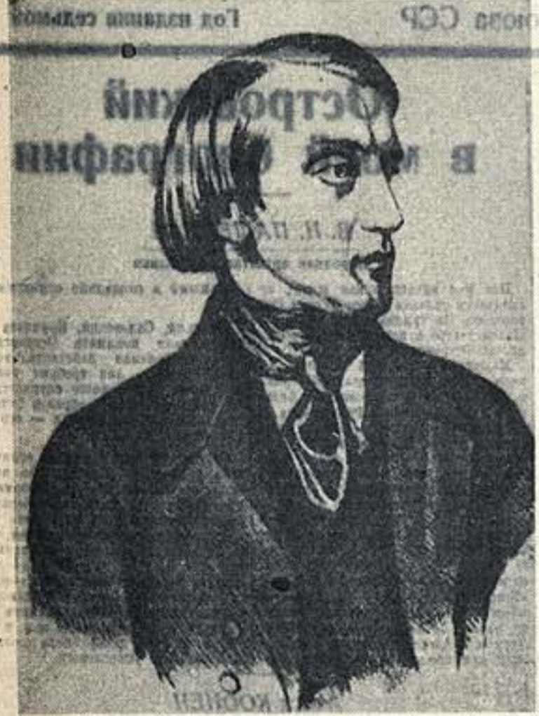
В. Г. Белинский. 1812-й день со дня рождения