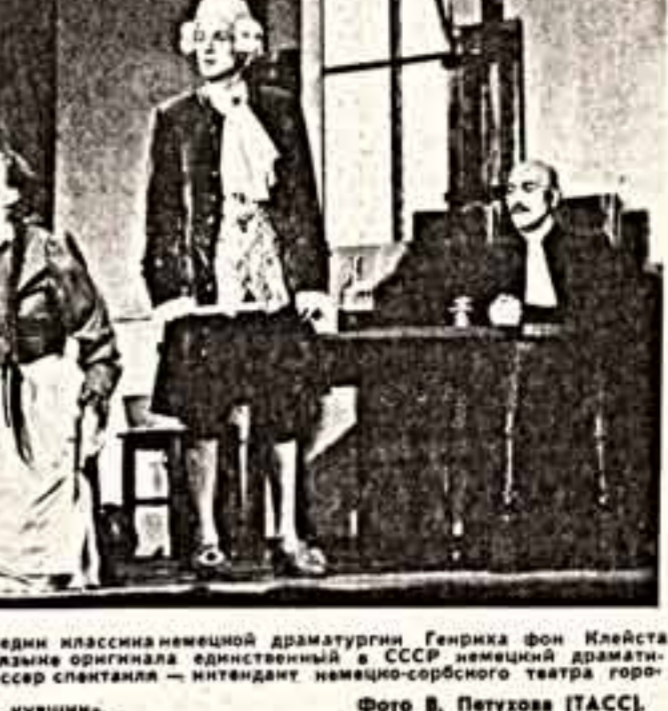
Первую в стране постановку комедии классика немецкой драматургии Генриха фон Клейста «Разбитый кувшин» осуществил на языке оригинала единственный в СССР армейский драматический театр (Г. Тимирязев). Режиссер спектакля — интендант немецко-советского театра города Бауца (ГДР) Рольф Гильберг.