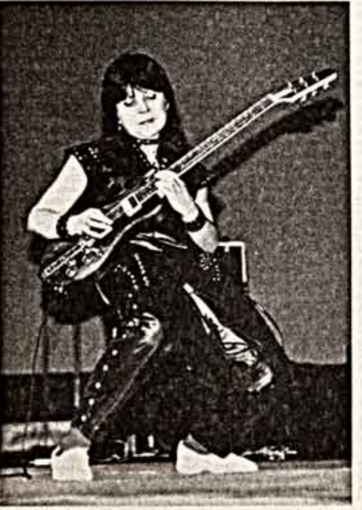
Этот рок! Пожалуй, нет. Дмаз? Скорее нет, чем да. Авангард! Наверное, нет, зато... Эстрада! Вот уж что нет, то нет. Группа «Комбо», стремительно набирающая популярность, играет на рок-фестивале, мейнстримный слэп музыки XX века...