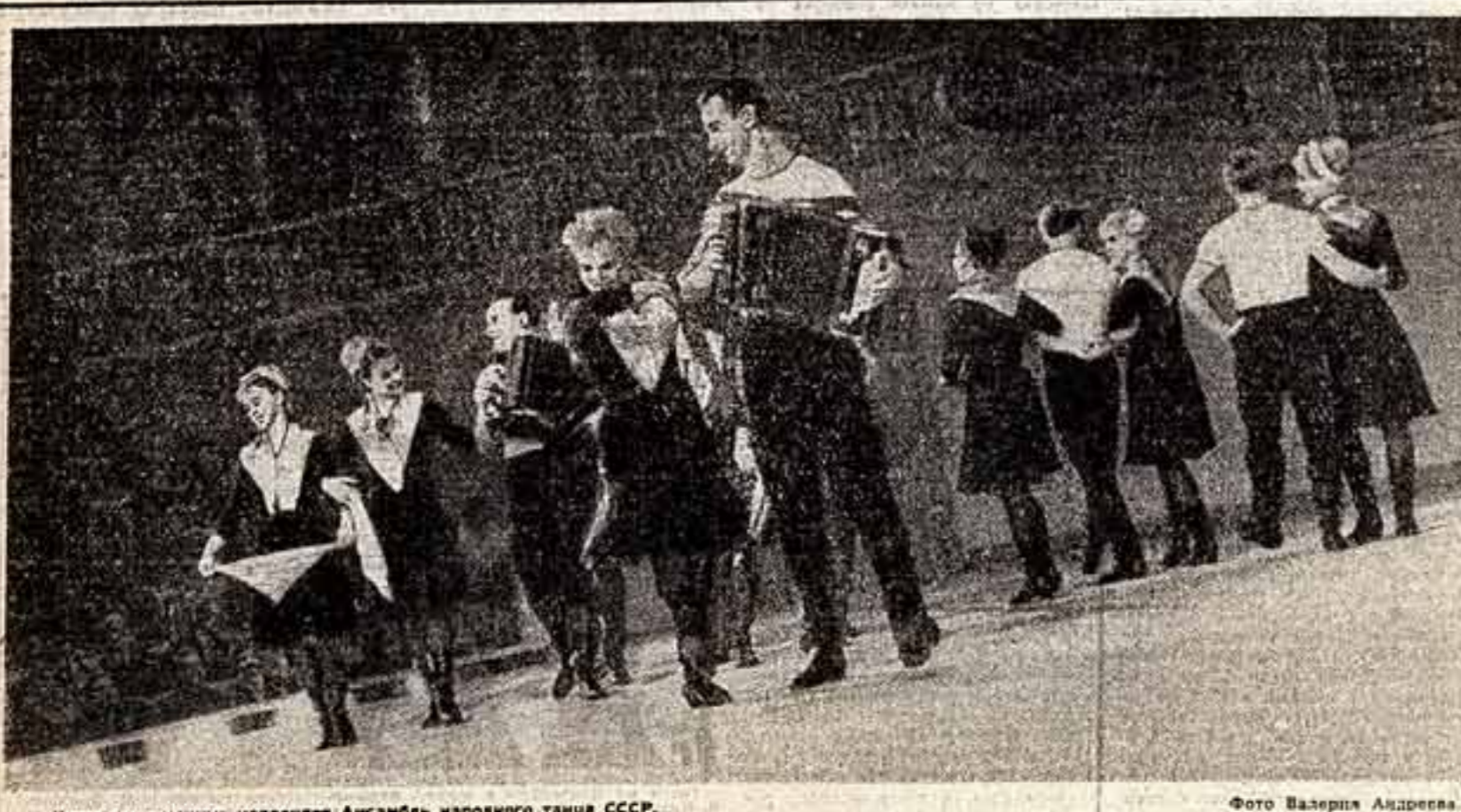
Колхозную улицу исполняет Ансамбль народного танца СССР.