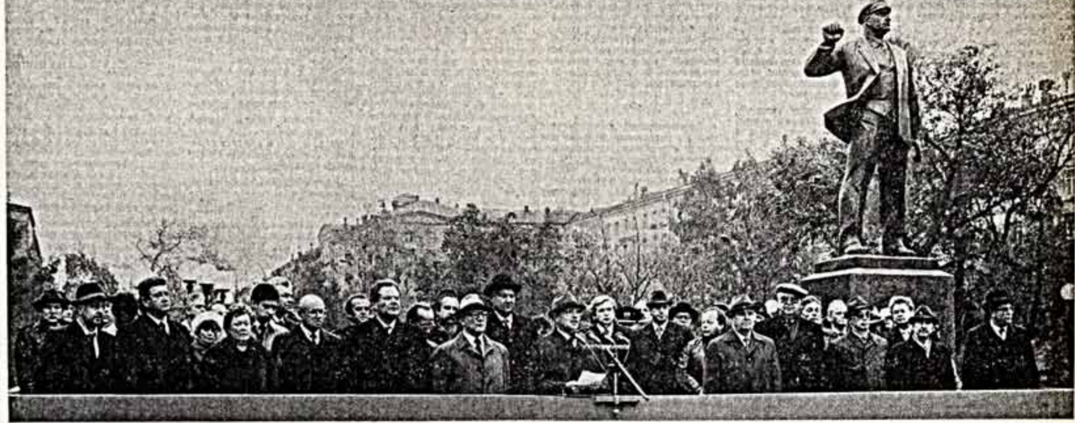
Во время митинга.