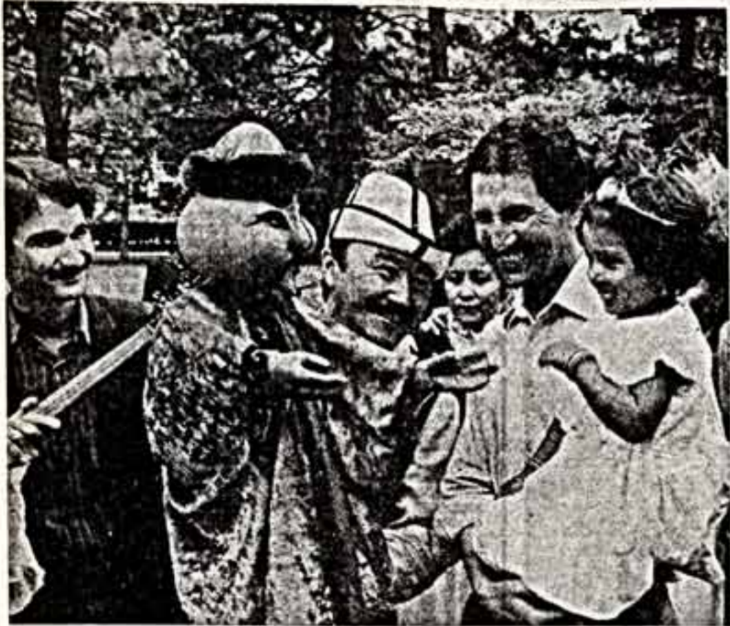
Плодотворно развиваются культурные связи между СССР и Демократической Республикой Афганистан...