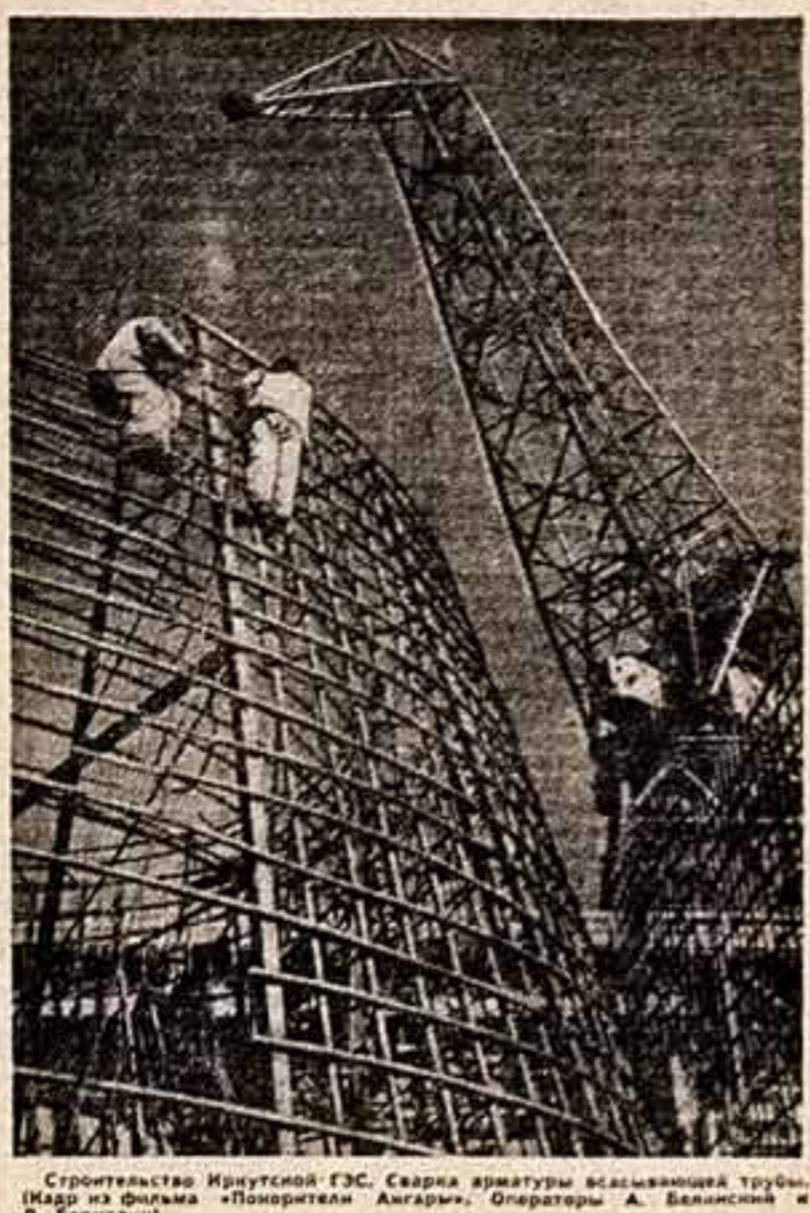
Строительство Иркутской ГЭС. Сверху: архитектура вальмовой трубы. (Кадр из фильма «Помогите Ангаре». Операторы А. Балашов и Л. Беренсон)

И тут Михаил Николаевич напрямик высказал свои мысли и претензии, которые, может быть, заставят призадуматься многих работников искусства. — Недавно повестка на кинооператоров и стали угаривать: разрешено нам снять заседание совхоза. А зачем? И почему обсуждение вопросов помещают, и артистам