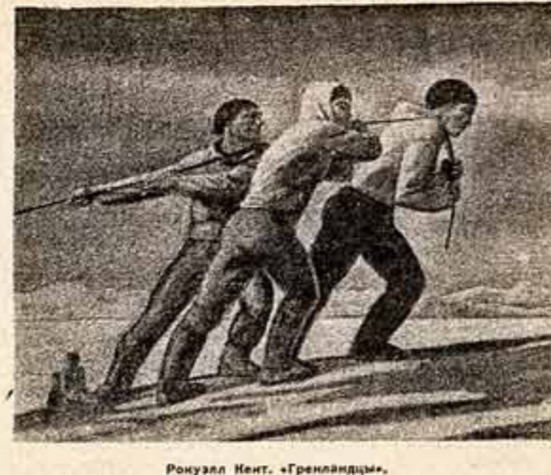
Рокуэлл Кент. «Грениландия».