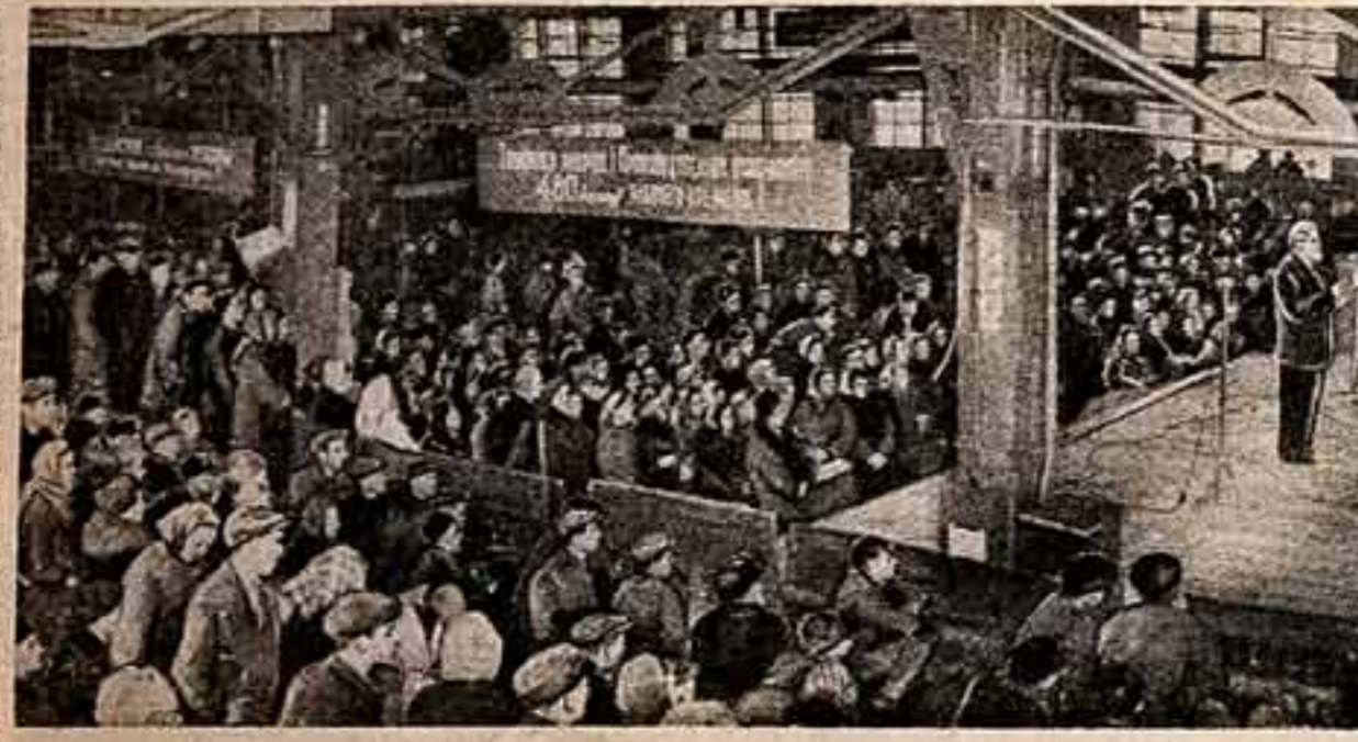
На снимке: белорусские гости на заводе имени Серго Орджоникидзе.