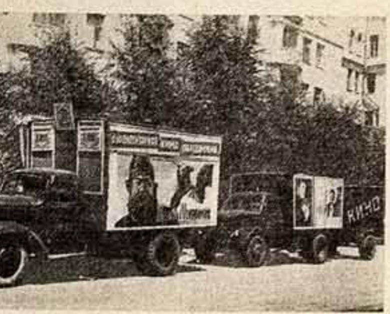
дт по полям Дубовского района, где только за неделю фильмы «Сестры» и «Илья Муромец» просмотрели более трех тысяч человек.

Сталинградское областное управление культуры сделало холостым, ведущим битву за хлеб в бескрайних приоволжских степях, прекрасный подарок — оборудовало первую в стране широкоэкранный кинопередвижку и послало ее на уборку. Кинопередвижка смонтирована на двух грузовых автомобилях: на одном находится киноаппаратура, на другом — передвижная электростанция. Смонтирована и изготовлена разборная рама экрана площадью 40 квадратных метров. Установка быстро собирается и разбирается. Ее обслуживают два механика и два шофера.