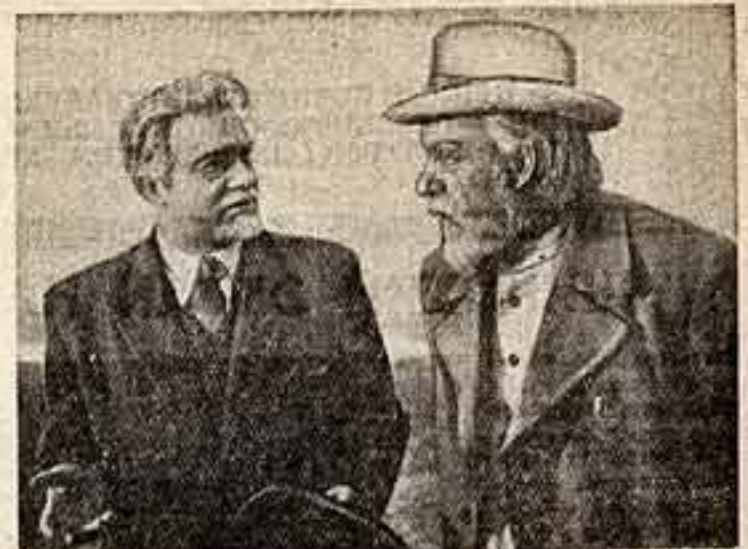
Сегодня, когда третий советский спутник яркой звездой пролетает над Землей, когда весь мир аллодурует нашим творцам ракет, сегодня мы с особой признательностью произносим имя К. Э. Циолковского.

Циолковский был обыкновенным калужским учителем. И он был тем первым человеком с планеты Земля, кто дерзнул уверенно заговорить о покорении космоса.