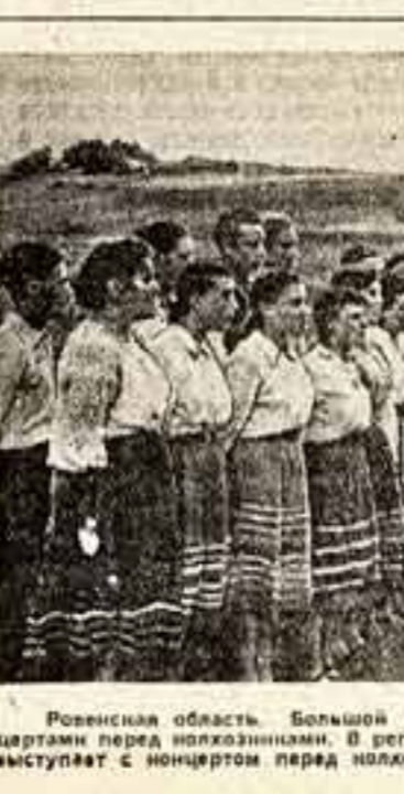
Ровенская область. Большой популярностью в Дубновском районе пользуются агитбригады села Дядьковичи, которая выступает с концертами перед колхозниками. В репертуаре бригады — хоры и сольные выступления с концертом перед колхозниками в перерыве полевых работ.

Или еще один пример: передавались в программах телевизионных «Прогулки по литературной Москве», посвященные Герцелю, Белому, Тургене-ву. Всем нам бесконечно дороги имена и замечательные творения этих писателей. Как интересно послушать адушевую беседу о событиях из жизни любимых писателей, о местах, где протекали их дни и годы! К сожалению, музыка в этих передачах настолько громкая, что порой даже не слышно диалога. Не только не успеваешь уловить текст, но и упускаешь отдельные детали из того, что показывается на экране.