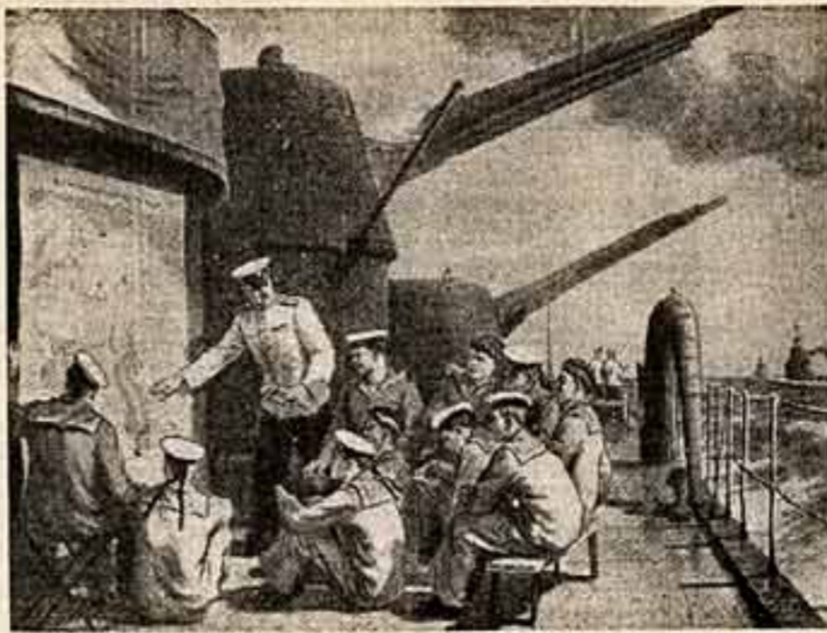
П. Баранов. «У карты Родины».

Художник В. РУДНЕВ, член Советского общества дружбы и культурной связи со странами Арабского Востока.