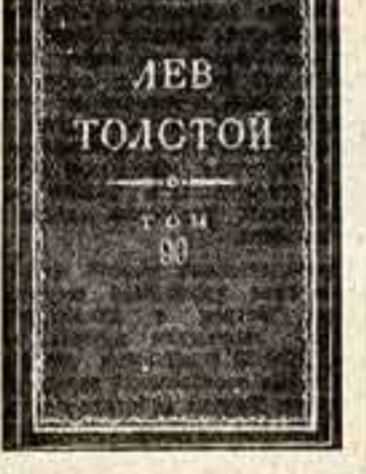
Дневники и записные книжки, вышедшие в 13 томах, охватывают период с 1847 по 1910 год. Здесь — записки юности Толстого, дневники Толстого Севастопольской обороны, позднейшие записки, отражающие душевное состояние писателя перед уходом из Ясной Поляны, и, наконец, последние записки, сделанные за четыре дня до смерти...

Немалый интерес представляет также раздел «Неопубликованное, неотрецензированное и неоконченное».