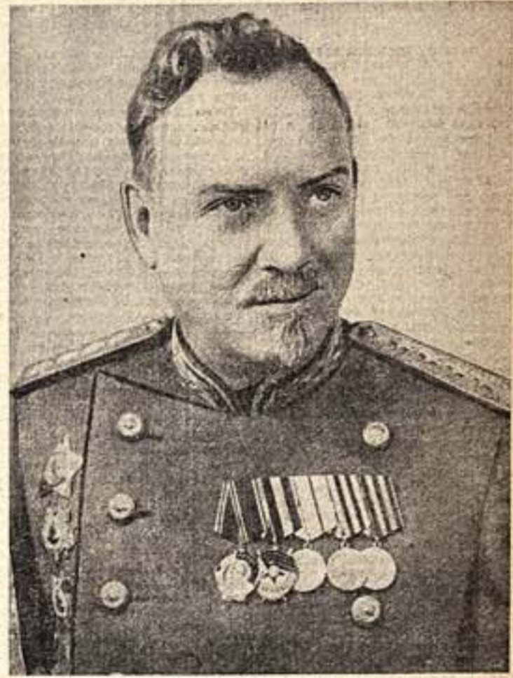
МИНИСТР ОРУЖИЙНЫХ СИЛ СОЮЗА ССР Н. А. БУЛГАНИН.