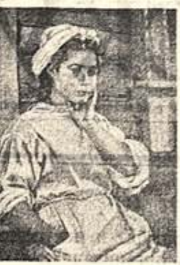
«Сестры». Художник Г. Шагаль.

Особенное произведение художника, которое должно установить прежде всего главные черты, что, как кажется, к нему стремился перейти, как стороны действительности, как бы в его творчестве. Именно под этим углом зрения нам хотелось бы рассмотреть весеннюю выставку, бесспорно, интересное событие в жизни нашего искусства.