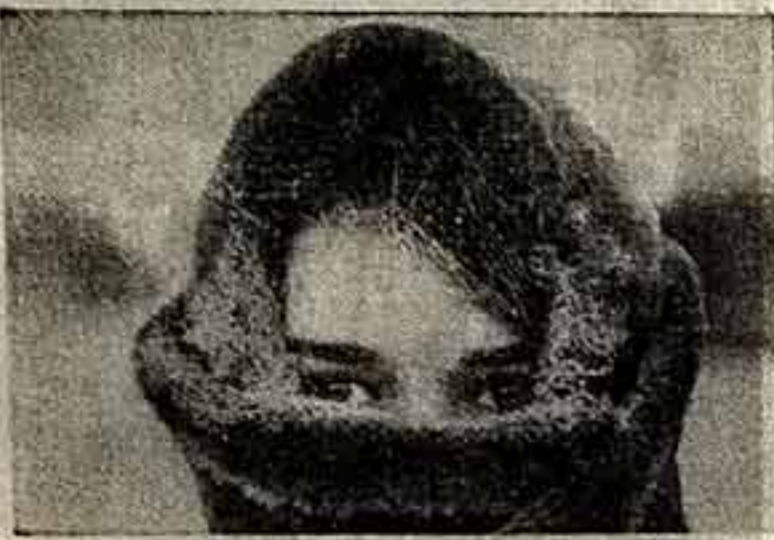
Ю. ЛУНЬКОВ. «Зимой».