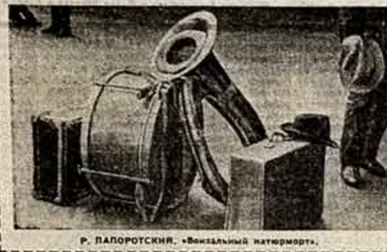
Р. ПАПОРОТСКИЙ. «Визальный натюрморт».