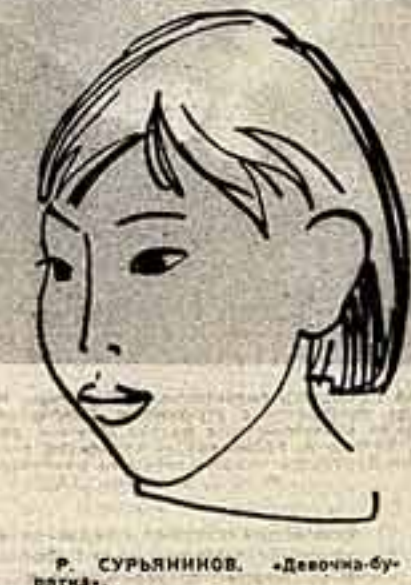
Р. СУРЬЯНИНОВ. «Девочка-бульдожка».