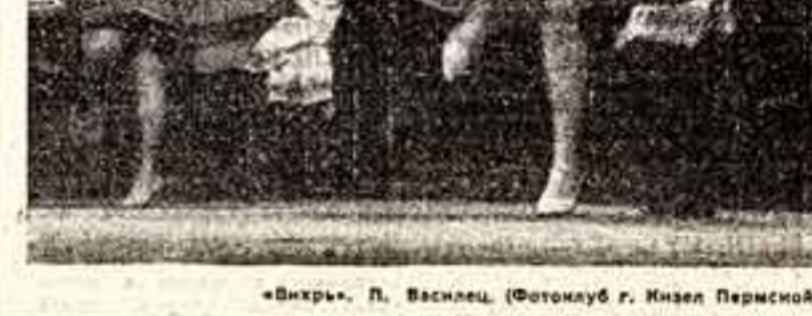
«Вихрь». П. Васнец (Фотолюб Г. Киев Пермской области).