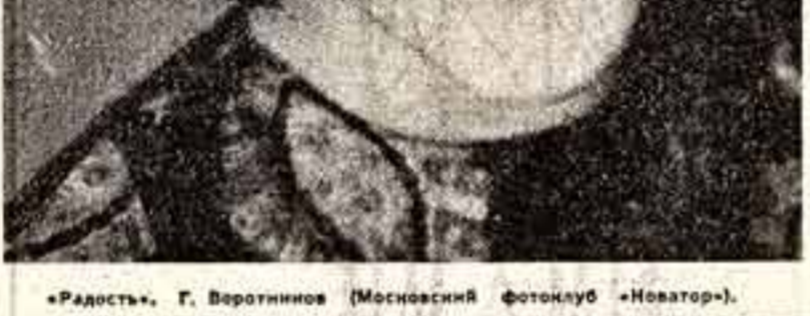
«Радость». Г. Веротиннов (Московский фотолюб «Новатор».)

Все так. И только дню дашься, в какой почти стерильной неприкосновенности сохранилась схема съемки. Сохранилось привычное, тыслу ра виденное о подобном