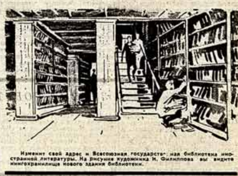
Изменит свой адрес и Всесоюзная государственная библиотека литературы. На рисунке художника И. Филиппова вы видите минифрагменты нового здания библиотеки.