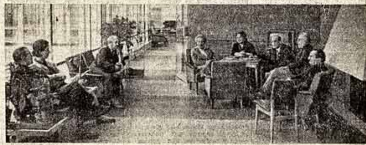
Один из интерьеров Дома ветеранов сцены.