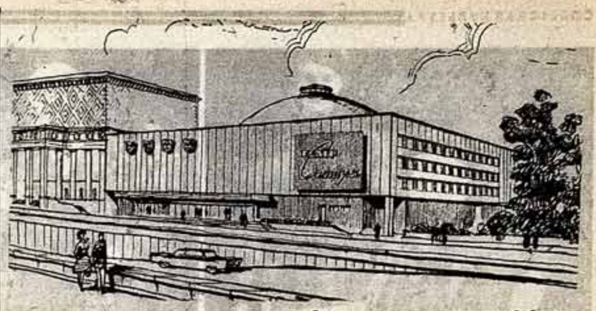
Рисунок автора проекта архитектора В. Степанова.

В канун Октября в столице открылась выставка искусства латышского искусства, рожденного в первые годы Советской власти и завоевавшего ныне весь мир своей неповторимой оригинальностью. Это выставка-ответ за преданных сороклетие, это выставка —