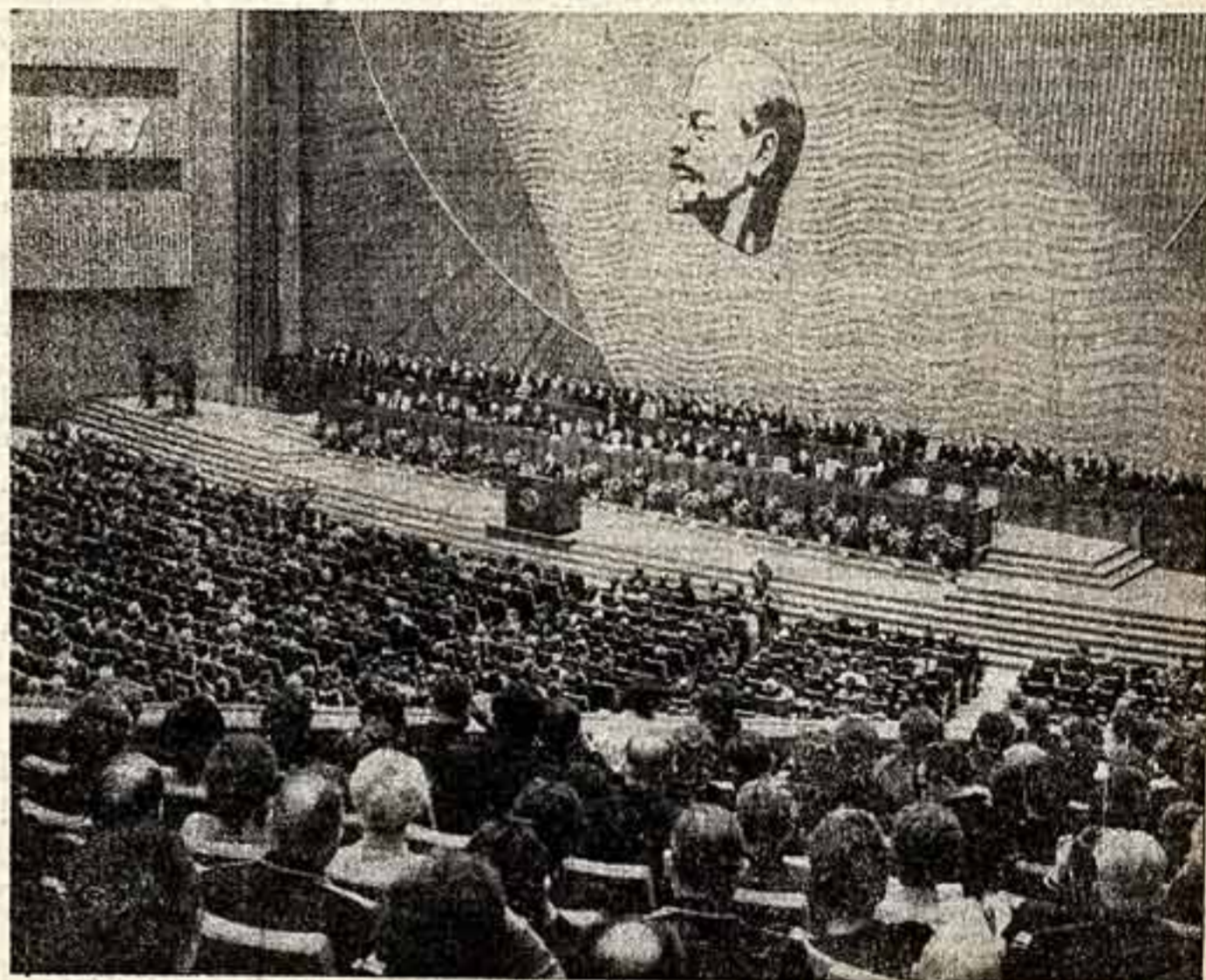
Вчера в Кремлевском Дворце съездов.

социализма и народы, ведущие борьбу против империалистического гнета, не буржуазия, а международный рабочий класс, силы, борющиеся за социалистическое переустройство общества, — вот кто определяет главное направление и особенности развития современного человечества. У советских людей все это время было завлечено напряженной борьбой за укрепление могущества Родины и лучшую жизнь. Огромные усилия потребовались для защиты Отечества от врагов. Сорок восьмой год Октября знаменателен прежде всего тем, что в этом году завершается важный этап — семилетний период развития народного хозяйства, развернулась большая работа по осуществлению намеченных Коммунистической партией крупных экономических реформ, по совершенствованию стилей и методов руководства страной. Обозревая путь, пройденный после Октябрьской революции, наша партия, весь советский народ по праву гордятся тем, что дело революции закреплено и приумножено, что именно на нашу долю выпала историческая задача первыми построить социализм. Именно нашей стране принадлежит честь прокладывать первые пути к самому совершенному строю общественной жизни — к коммунизму. Это вдохновляет советских людей на новые замечательные дела, на героический труд.