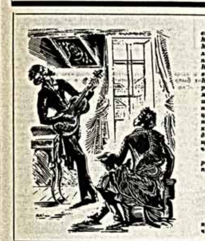
Иллюстрация художника А. Краченко к произведению А. С. Пушкина «Евгений Онегин».

— Идея эти родилась среди историков и теоретиков русской литературы XIX—XX веков еще в прославленные времена востока. В литературоведении всегда были люди, которые видели, что дело обстоит совсем не так, как пытаются уверить многие научные труды и учебники. К примеру, за первые десятилетия XX века зарешились результаты «эпохи десятилетия» в историческом интеллигентизме. А между тем существование одного языка — между тем существование опровергает. И Ленин, и Горький, заграничные во время десятилетия, в jednu определенную сторону поведки интеллигентизма. Но интерпретации истолковали эту мысль слишком широко. Подобный автономический принцип трактовки событий — когда часть выдается за целое — долгие годы был у нас в ходу. Он не исчез и ныне. Внутривластные, внутрисоциологические полемизмы процветали во всю историю культуры, историю общественного движения. Таким образом, из истории литературы исключили по сути дела весь серебряный век — Бальмонта, Вячеслава Иванова, экспериментарство Сологуба, Бальго. Оригиналные авангардистские течения тех лет оценивались, как правило, со значком минус. Так полагали «облые пятны» в нашей отечественной культуре.