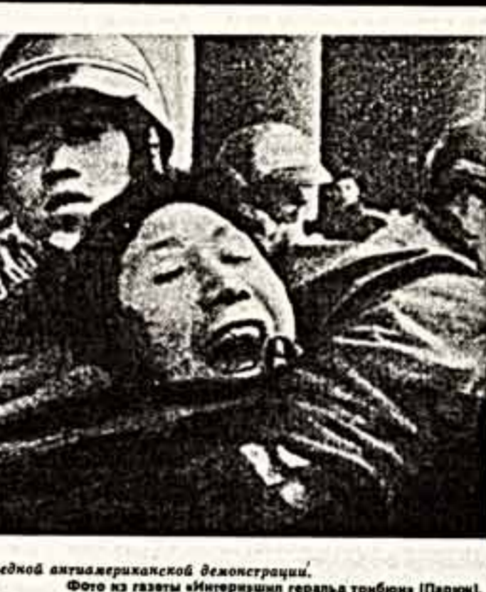
Южная Корея. Разгон очередной антиамериканской демонстрации.