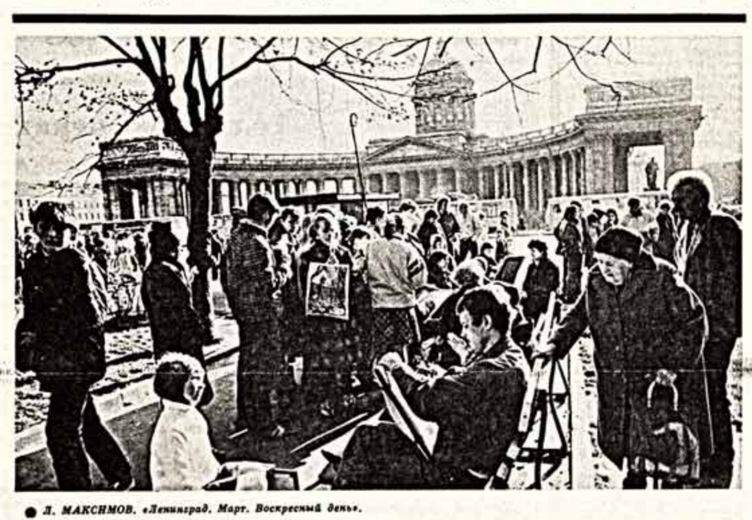
Л. МАКСИМОВ. «Ленинград, Март. Воскресный день».

Я живу в городе на Неве с 1932 года. Во время войны пережил все, выпавшее на долю ленинградцев. Потерял отца, бойца народного ополчения, остался вдвоем с матерью, она работала на «Ирвисин» тракторном заводе.