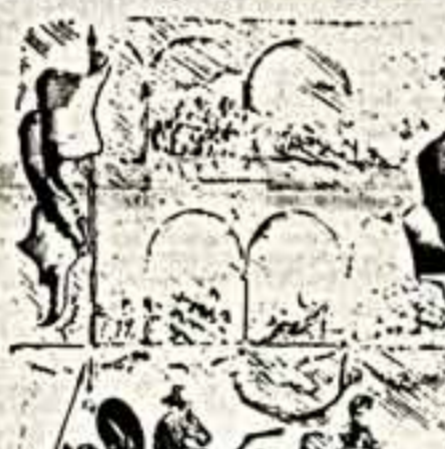
Иллюстрация художника А. Краченко к произведению А. С. Пушкина «Евгений Онегин».

Сегодня мы приглашаем читателей об иллюстрациях, сделанных замечательным графиком и художником А. С. Краченко.