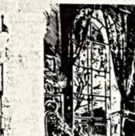
Иллюстрация художника А. Краченко к произведению А. С. Пушкина «Евгений Онегин».