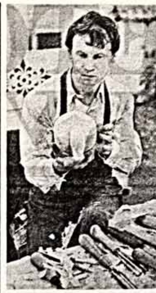
Артельские экспериментальные предприятия народных художественных промыслов «Возвращение» успешно работают над возрождением, развитием традиционных искусств русского Севера и созданием новых видов художественных изделий, основанных на этих традициях. Строительные изделия, сувениры из меха и замши, художественные изделия из керамики и камня пользуются большим спросом не только на территории страны, но и за рубежом.

Не помалели свободное время на стройки жилья и объектов социальнотехнического назначения Ленинградского областного строительного-отделочного треста. И вот результаты: десятки рабочих и специалистов получили благоустроенные квартиры в новом доме, построенном хозяйственным способом. А рядом сооружены еще одно здание со спортивным залом, лечебно-восстановительным центром. Поддерживая инициативу трудящихся ВАЭ — ускорить строительство объектов культуры и быта, коллектив предприятий распределял силы так, чтобы оказать максимальную помощь городу. Машинистами принимал на баланс городской стадион и реконструируют его. Лицейская область.