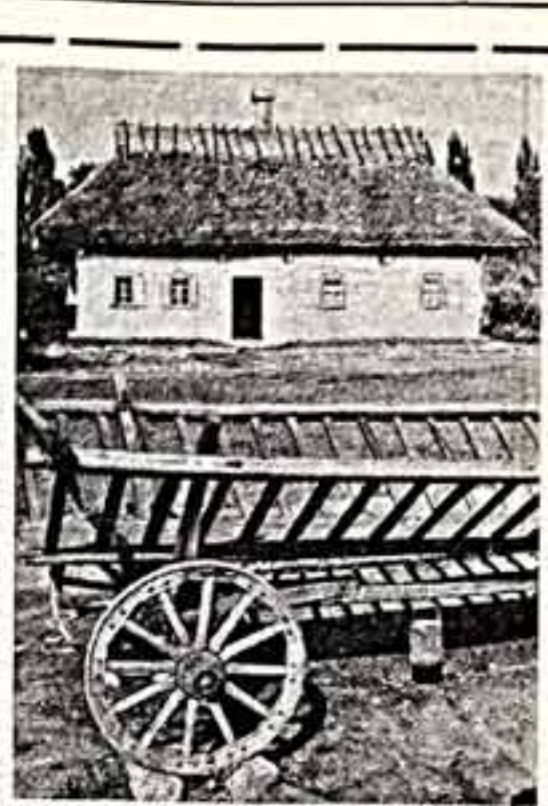
Многочисленные и разнообразны культурные памятники, оставленные нам в наследие прошлых лет...