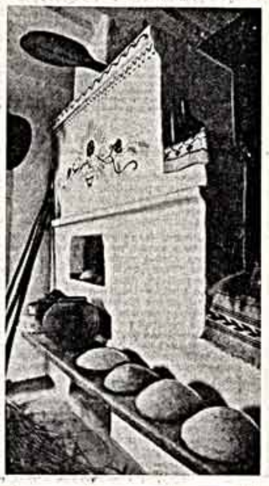
Фрагменты экспозиции Переславля-Залеского музея хлеба.