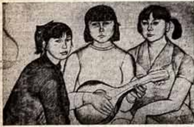
«Девчата с Нурек».