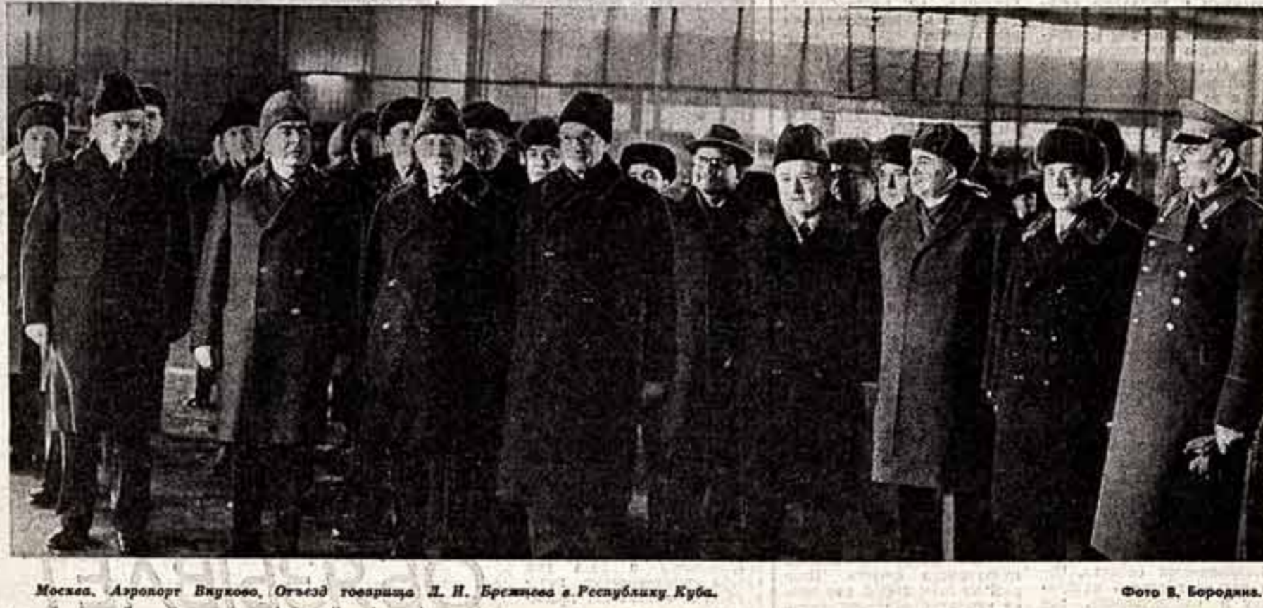
Москва. Аэропорт Внуково. Отъезд товарища Л. И. Брежнева в Республику Куба.