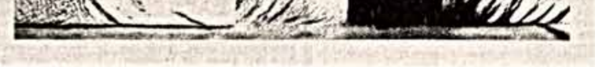
Сцена из композиции «Конфронтация».

Вот, скажем, знаменитый спектакль «Ван-Клонт» постановленный нашим прославленным режиссером Андреем Гончаровым на сцене Театра имени Ва. Маяковского