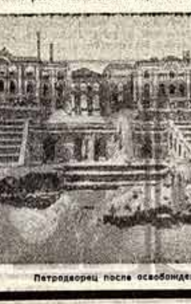
Петродворец после освобождения (1944 год).

В МОСКВЕ воздвигнут памятник основателю города Юрию Долгорукому (Скульптор С. Олоп, при участии А. Антонова и И. Штамма).