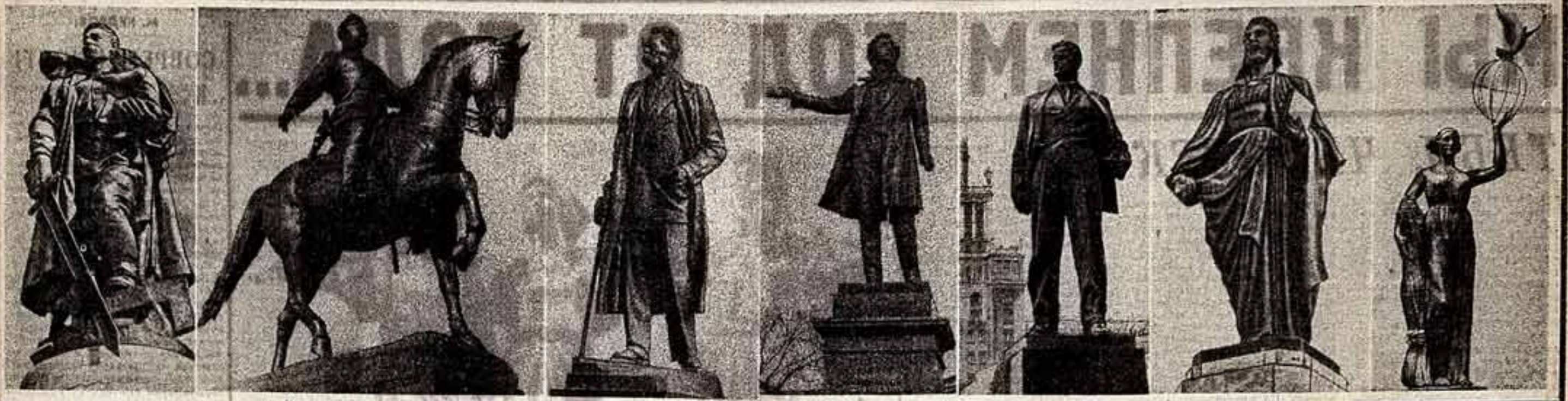
Ленинский павильон «монументальной пропаганды» — в действии. В эти годы воздвигнуты памятники и монументы, ставшие частью советского искусства. Слева направо: «Война-освобождение», памятник советским воинам в Берлине (1949 г.) — Е. Вучетич; памятник Котляковскому в Кисловодске (1953 г.) — Л. Дубова; К. Кайгородов, М. Першуткина и А. Посадов; памятник Горькому в Москве (1955 г.) — В. Мухомов, Н. Зенковская; П. Ивановой (по первоначальному проекту М. Шадря); памятник Пушкину в Ленинграде (1958 г.) — М. Аникушина; памятник Маяковскому в Москве (1958 г.) — А. Кибальникова; памятник Икшанам в Кирово-Чугое (1966 г.) — Л. Абдураманова; статуя «Мир» на здании планетария в Волгограде (1953 г.) — В. Мухомов.