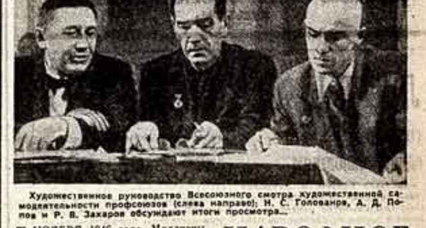
А. СОКОЛЬСКИЙ. (Из сборника «Слушая время». Музыка. 1964 г. Из материалов Ю. Прокофьева).