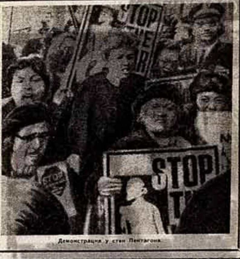
Демонстрация у стен Пентагона

Недавнее возобновление налетов американской авиации на демократическую Республику Вьетнам, активизация действий суопутных частей на юге страны раз убеждают американскую общественность, в том, что военная машина Соединенных Штатов и не помышляет сбавлять обороты, наоборот, убыстряет, раскручивает маховик агрессии.