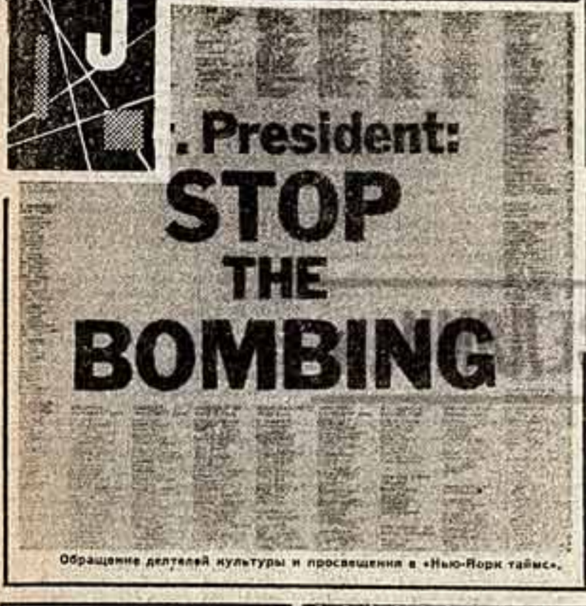
Обращение деятелей культуры и просвещения в Нью-Йорк таймс.

«ЕСЛИ бы Джонсон заявил, что мы живем в ХХ веке, многие американцы поверили бы этому. Может быть, это самое умное последнее слово во Вьетнаме для американского общества. Эту горючую шутку привела французская газета «Мондо» в недавнем сообщении своего американского корреспондента, расшифровав ее смысл»