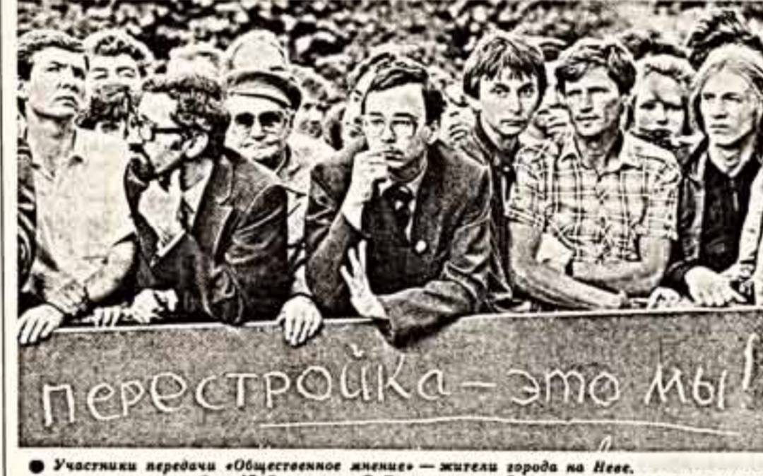
Участники передачи «Общественное мнение» — жители города на Неве.

Еще совсем недавно, летом прошлого года, я