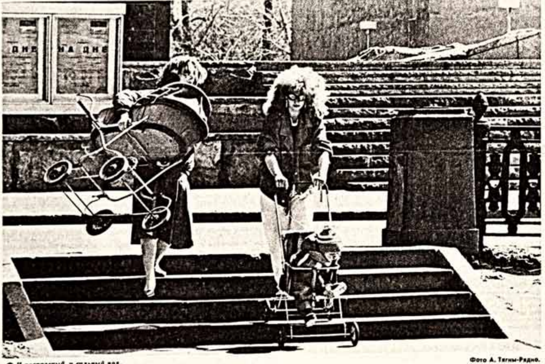
И прекрасней, и сильнейшей лоя. Фото А. Тегин-Радно.