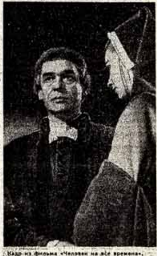
Кадр из фильма «Человек на все времена».